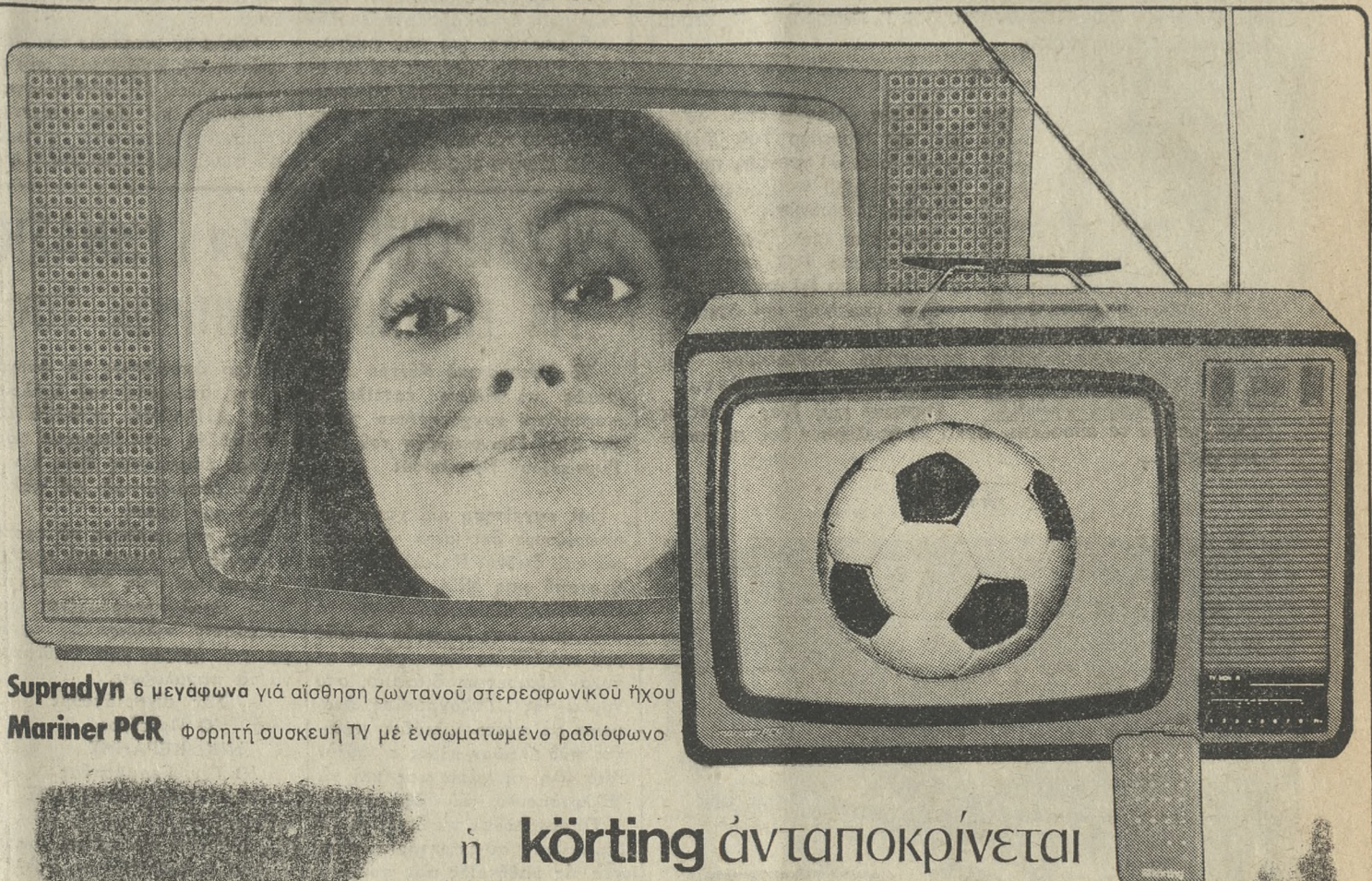
Supradyn 6 μεγάλωνα για άίσθηση ζωντανού στερεοφωνικού ήχου Mariner PCR Φορητή συσκευή TV με ένσωματωμένο ραδιόφωνο

ή körting ανταποκρίνεται στην έπίθυμία σας για: