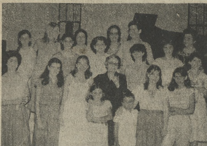
Τα παιδιά της Σχολής Πιάνου του Ωδείου Ηρακλείου, που πήραν μέρος στην εκδήλωση που έγινε στον Άγιο Μάρκο, μαζί με τις καθηγήτριά τους, σε ένα αναμνηστικό στιγμιότυπο.