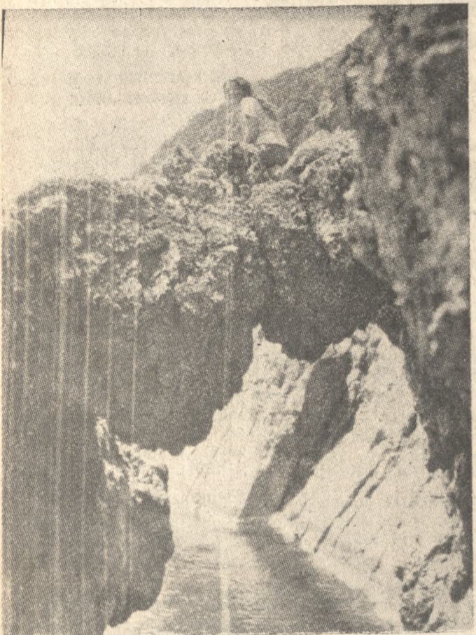
Στιγμές είναι μάτια μου η ζωή. Μόνο στιγμές, που με το γέλιο θές...