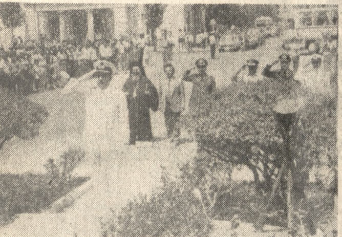
Το πολεμικό πλοίο «ΕΛΛΗ» κατέπλεσε στο λιμάνι του Ηρακλείου, στα πλαίσια των εκδηλώσεων της Ναυτικής Εβδομάδας...