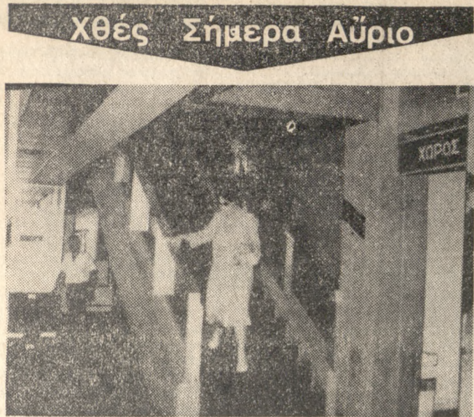
Χθές Σήμερα Αύριο

Πέρασε χθές από το Ηράκλειο η Βασίλισσα της Ολλανδίας Βεατρίκη, μαζί με τα παιδιά της. Το αεροπλάνο με το οποίο ήρθε η Βεατρίκη — τύπου FK 28 — προερχόταν από την Πίζα και προοιζώθηκε στο αεροδρόμιο της πόλης μας στις 11,40' το πρωί για άνεφοδισμό. Η Βασίλισσα της Ολλανδίας πήγε στην αίθουσα επίσημων τών αεροδρομίου όπου έμεινε μέχρι 12,30' το μεσημέρι όποτε και αναχώρησε για το Χαρτφύ. Στη φωτογραφία η Βεατρίκη ενώ κατευθύνεται από την αίθουσα επίσημων στο αεροδρόμιο για να αναχωρήσει.