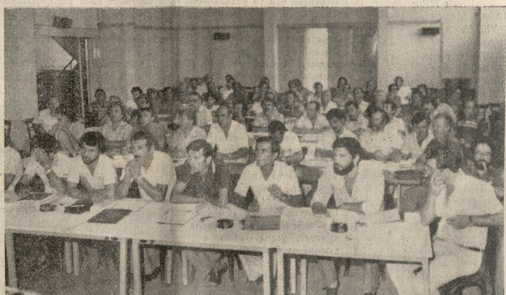
Δεκάδες στελέχη του εργατικού κινήματος της Κρήτης παρακολουθούν τις εργασίες του επιμορφωτικού συνδικαλιστικού σεμιναρίου, όπως βλέπουμε και στην φωτογραφία - μ.κ.

Τά θέματα του καλύπτουν τους γενικότερους προβληματισμούς και στόχους της Γ.Σ.Ε.Ε. πάνω στην ιστορία, την πορεία και την εξέλιξη του εργατικού συνδικαλιστικού μας κινήματος.