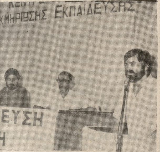
Ένας από τούς εισηγητές του σεμιναρίου που γίνεται στο Ε.Κ.Η. και δίπλα - του το προεδρείο, σε ένα φωτογραφικό στιγμιότυπο.