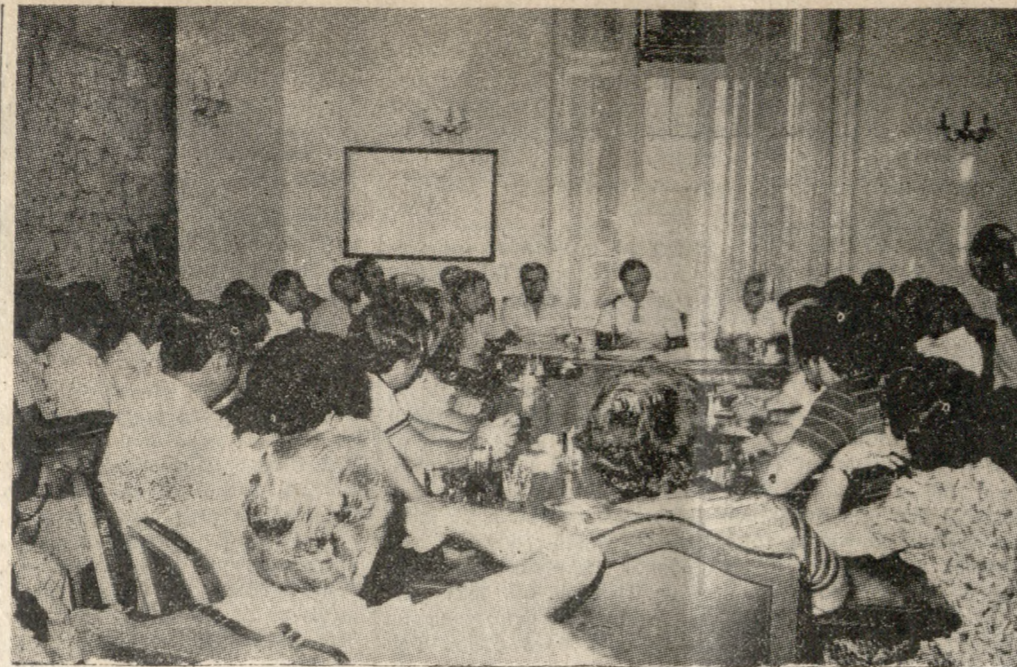
Στιγμιότυπο από την χθεσινή σύσκεψη.