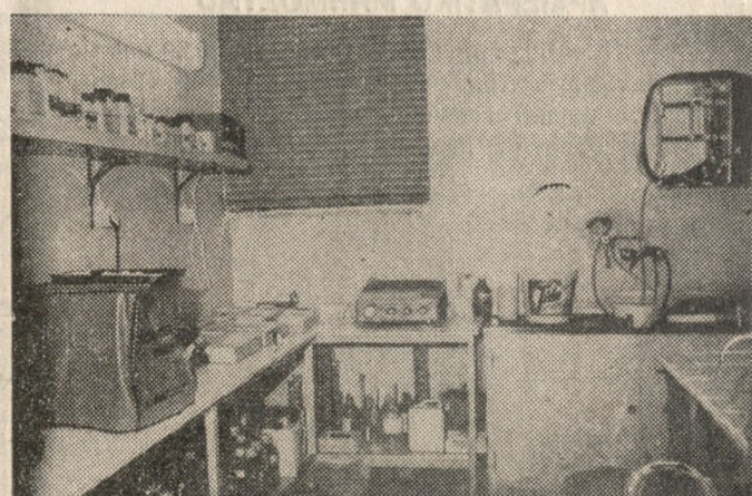
Η Μονάδα Προλήψεως της Μεσογειακής Άναιμίας που λειτουργεί εδώ και 3 χρόνια στο Βενιζέλειο και παρέχει τις υπηρεσίες - της δωρεάν.