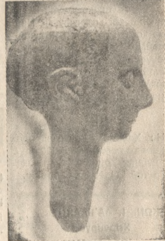
Τό ελεφαντινό κεφάλι ελεφάντινου στο άποιο διακρίνονται καθαρά τά προσωπογραφικά χαρακτηριστικά, τμήμα του χρυσελεφάντινου συμπλεγματος.