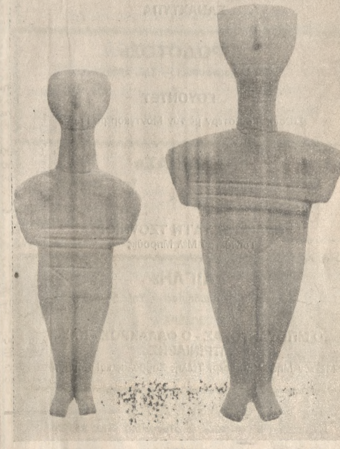
Δύο μαρμάρια κυκλαδικά ειδώλια, εύρήματα άπο τό Φουρνί.