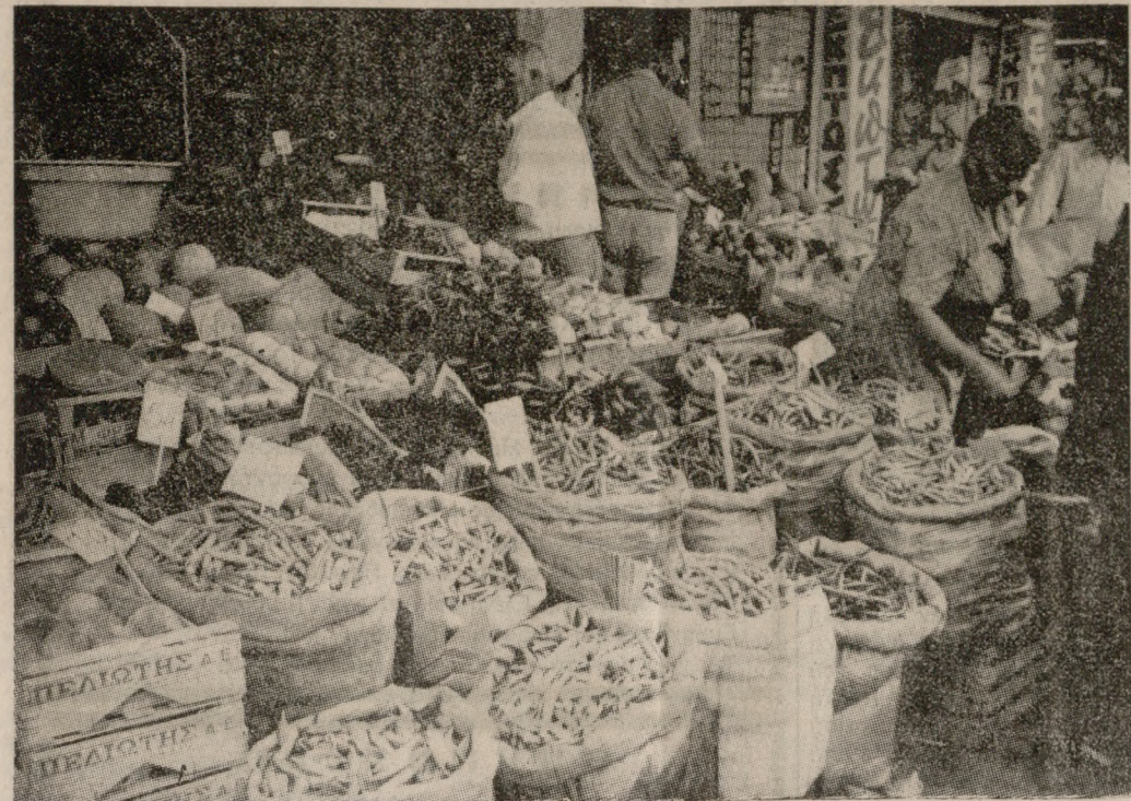
Η φωτογραφία είναι χθεσινή και αρκετά εύλαπτη. Δείχνει την επάρκεια των αγροτικών προϊόντων που υπήρχε χθες στην αγορά του Ηρακλείου.