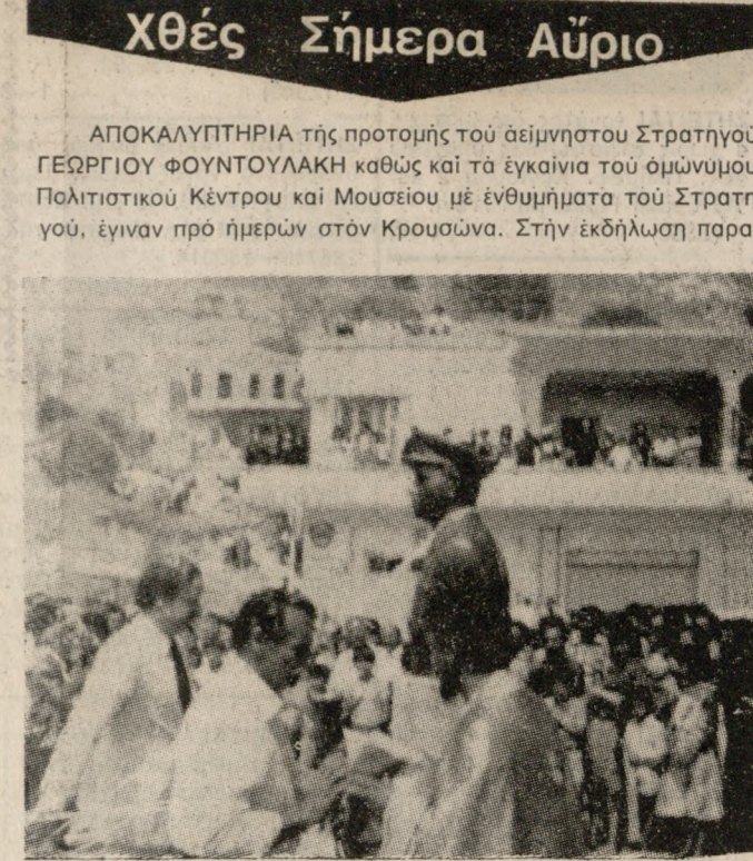
Βρέθηκαν ο υφυπουργός κ. Κ. Ασλάνης ο οποίος έκοψε και το αποκαλυπτήριο, ο Σεβ. Αρχιεπίσκοπος Κρήτης κ. Τιμοθέος, ο Μέγας Χορός υποστράτηγος κ. Εμμ. Αναπάκης, ο Νομάρχης και ο Δήμαρχος Ηρακλείου, οι γυμναστές του Στρατηγού, πολλοί Ηρακλειώτες πολίτες από τα γύρω χωριά του Κρουσιώνα και όλοι οι κάτοικοι του Κρουσιώνα.

ιβ. Η συμμετοχή μας σ' αυτές τις εκλογές είτε μέσα από συνδυασμό ευρύτερης συνεργασίας είτε με συνδυασμό που θα έχει κύριο κομμάτι τις κομματικές και άναυευστικές άριστερες δυνάμεις πρέπει να έχει τη σφραγίδα της ποιότητας και της συνέπειας στις βασικές επιλογές και τη συσπώνωση του ΚΚΕ έσωτερικώς.