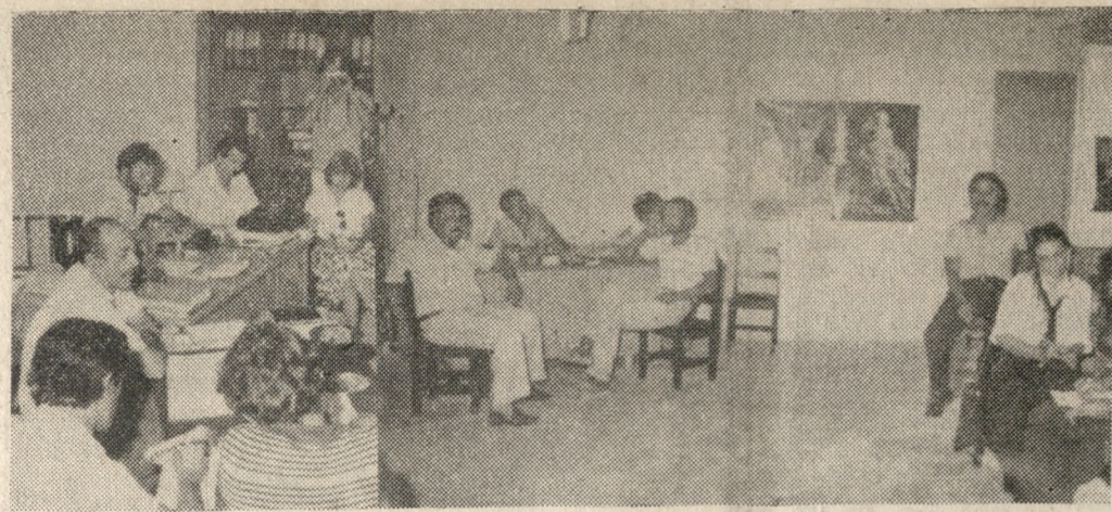
Στιγμιότυπο από την χθεσινή συνέντευξη, με την αφορμή του Α' Παγκλητίου Συνεδρίου Συνδεδεμένων.