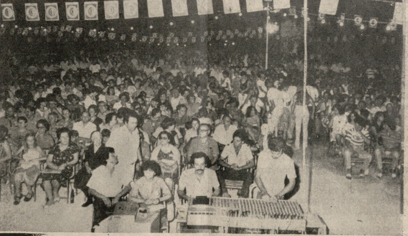
Σήμερα τελειώνουν οι γιορταστικές εκδηλώσεις της Νεολαίας του Π.Α.Σ.Ο.Κ., που γίνονται στο πάρκο Γεωργιάδη. Χθες το βράδυ μιλήσε ο Γεν. Γραμματέας του Π.Α.Σ.Ο.Κ. Ελλάδος ΣΤΕΦΑΝΟΣ ΜΑΝΙΚΑΣ απηύθυνε δε χαιρετισμό ο Υφυπουργός Συγκοινωνιών ΚΩΣΤΑΣ ΑΣΛΑΝΗΣ. Απόψε θα κλείσει τις τριήμερες γιορτές ο Υπουργός Δημ. Έργων κ. Άλκης Τσαχατζέπουλος με ομιλία δε. Αναμένεται δε ότι παρά πολλές κόσμες θα λάβει και σήμερα μέρος στις εκδηλώσεις.