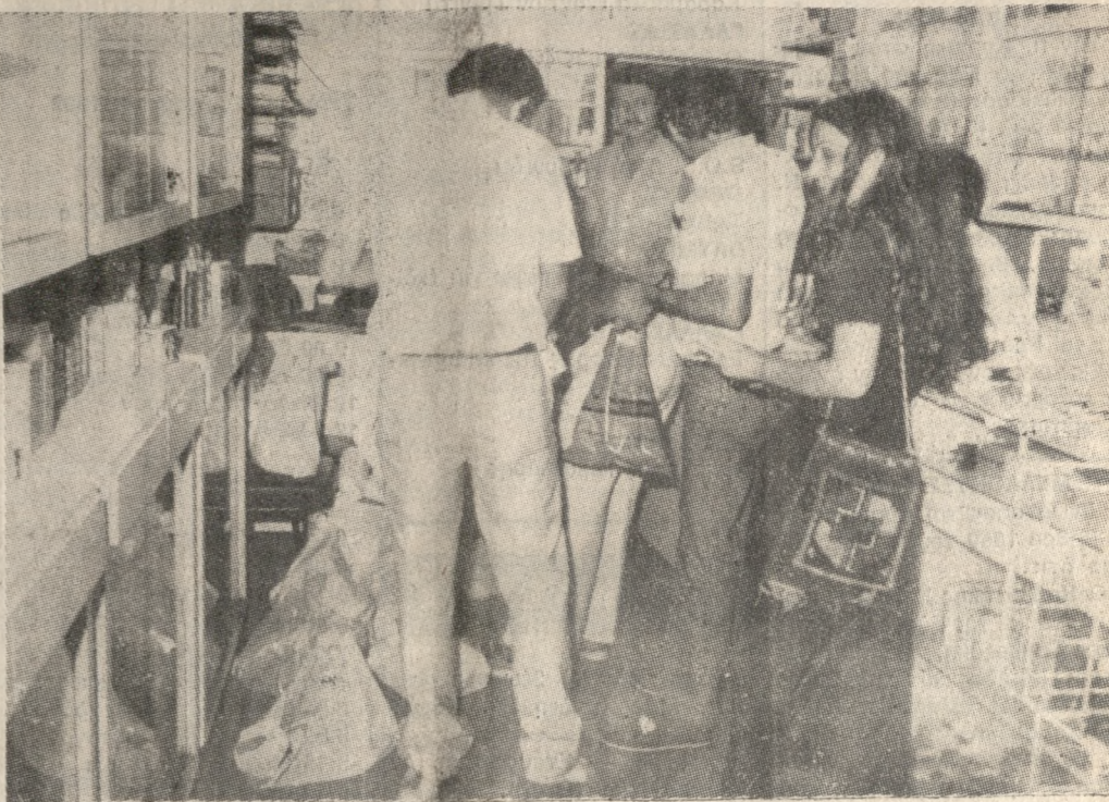
Οι Παλαιστίνιοι γιατροί ενώ παραλαμβάνουν τα φάρμακα που συγκεντρώσαν οι Ηρακλειώτες φαρμακοποιοί.

Σε περίπτωση που μέχρι τις 31 Αυγούστου ο εργαζόμενος δεν επιλέξει τις συνδικαλιστικές οργάνώσεις που θα μείνει μέλος και οι νομοί της διενέργειας του οποίου υπολείπονται τότε είναι έκτακτος μέλος.