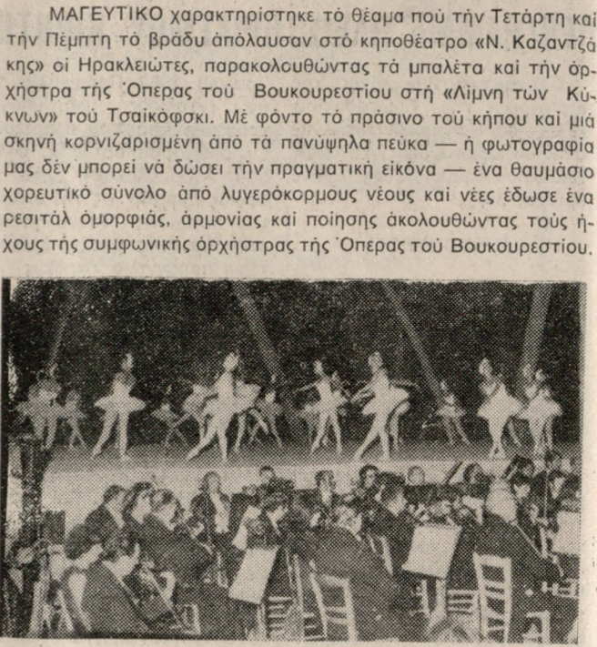
ΜΑΓΕΥΤΙΚΟ χαρακτηρίστηκε το θέμα που την Τετάρτη και την Πέμπτη το βράδυ άπολασαν στο κηροθέατρο «Ν. Καζαντζήκης» οι Ηρακλειώτες, παρακολουθώντας τα μαλάτα και την ορχήστρα της 'Οπερας του Βουκουρεστίου στη «Μηνιά των Κυνών» του Τσαϊκόφσκι. Με φόντο το πρόσωπο του κηπουρού και μία σκηνή κορυφαρίων από τα πανηγύρια πευκά — η φωτογραφία μας δίνει μία άποψη της πραγματικής εικόνας — ένα θαυμάσιο χορευτικό σύνολο από λυγρόκορμους νέους και νέες έδωσαν ένα ρεσιτάλ όμορφης, αρμονίας και ποιήσεως ακολουθώντας τους ήχους της συμφωνικής ορχήστρας της 'Οπερας του Βουκουρεστίου.

Ο κόσμος ένθουσιασμένος από το σπάνιο θέαμα άποθέωσε τους ξένους καλλιτέχνες. Οι εμφανίσεις του ξένου συγκροτήματος συνεχίζονται σήμερα αύριο και τη Δευτέρα με το παρακάτω πρόγραμμα. Σήμερα 11 Σεπτεμβρίου ώρα 9.30 «Βραδιά Μπαλέτου» με συμμετοχή του Μπαλέτου και της Ορχήστρας της 'Οπερας του Βουκουρεστίου στα έργα: «Σοπενίνα» του Σοπέν, «Κάρμεν» του Μπιζέ και τρεις «Ρομαντικές ραψωδίες» του Ενγκού εϊδικά διασκευασμένα για μαπάλετο. Στο κηροθέατρο «Ν. Καζαντζήκης». Αύριο 12 Σεπτεμβρίου ώρα 9.30, Συμφωνική συναυλία με έργα Μπετόβεν με την Ορχήστρα της 'Οπερας του Βουκουρεστίου υπό την διεύθυνση του Βύρωνα Κολοσσά και με σολίστ τον 'Αρη Γαρουφαλή. Στο μικρό κηροθέατρο. Δευτέρα 13 Σεπτεμβρίου ώρα 8 Ρεσιτάλ κλασικού τραγουδιού με το δίσσημο Ρομάνο Βαρούτσιο Νικολάε Χερλάκι και σολίστ στο πιάνο τον 'Αρη Γαρουφαλή. Στο μικρό κηροθέατρο. Το βράδυ της ίδιας ημέρας στις 9.30. Βραδιά μαπάλετου με το ίδιο πρόγραμμα της 11-9-1982. Στο κηροθέατρο «Ν. Καζαντζήκης».