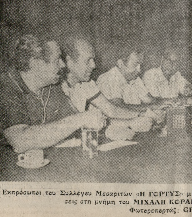
Εκπρόσωποι του Συλλόγου Μεσαριτών «Η ΓΟΡΤΥΣ» μιλούν για τις εκδηλώσεις στη μνήμη του ΜΙΧΑΗΛ ΚΟΡΑΚΑ.

Μιλώντας για τους στόχους αυτούς ό εκπρόσωποι του συλλόγου, τόνισαν ότi είναι διπλοί. Πρώτον να πραγματοποιηθούν πολιτιστικές εκδηλώσεις στην περιοχή αυτή, και δεύτερον - και κυριότερο - μέσα όπν τέτοιες προσπάθειες σε συνδυασμό και με άλλες ενέργειες προς τα άρμόδια ύπουργεία (Πολιτισμού, αΠθειας, Συγκοινωνιών κλπ) να γίνει γνωστό το άνάστημα αυτού του ήρωα της Κρητικής επανάστασης σε όλη την Ελλάδα.