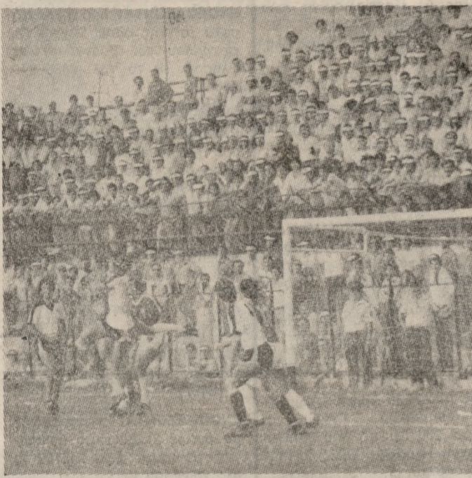
Ένα στιγμιότυπο από τον αγώνα ΟΦΗ—ΠΑΟ.