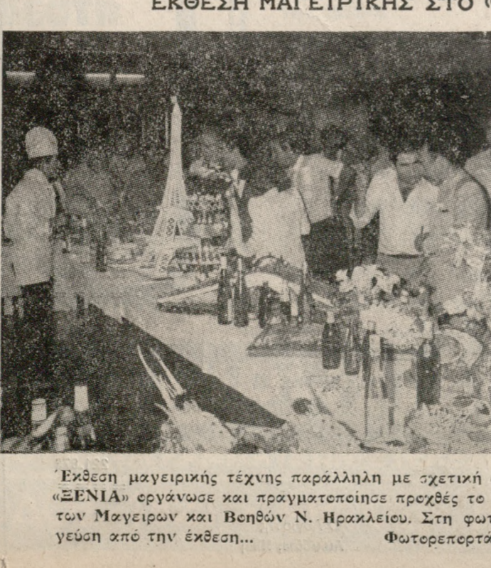
Έκθεση μαγειρικής τέχνης παράλληλη με σχετική συνέντευξη στο ξενοδοχείο «ΞΕΝΙΑ» εργαζόμενων και πραγματοποιήσε προχθές το βράδυ. ο Συνδυασμός Τεχνιτών Μαγειρών και Βελών Ν. Ηρακλείου. Στη φωτογραφία μας, μια εκτίθε...