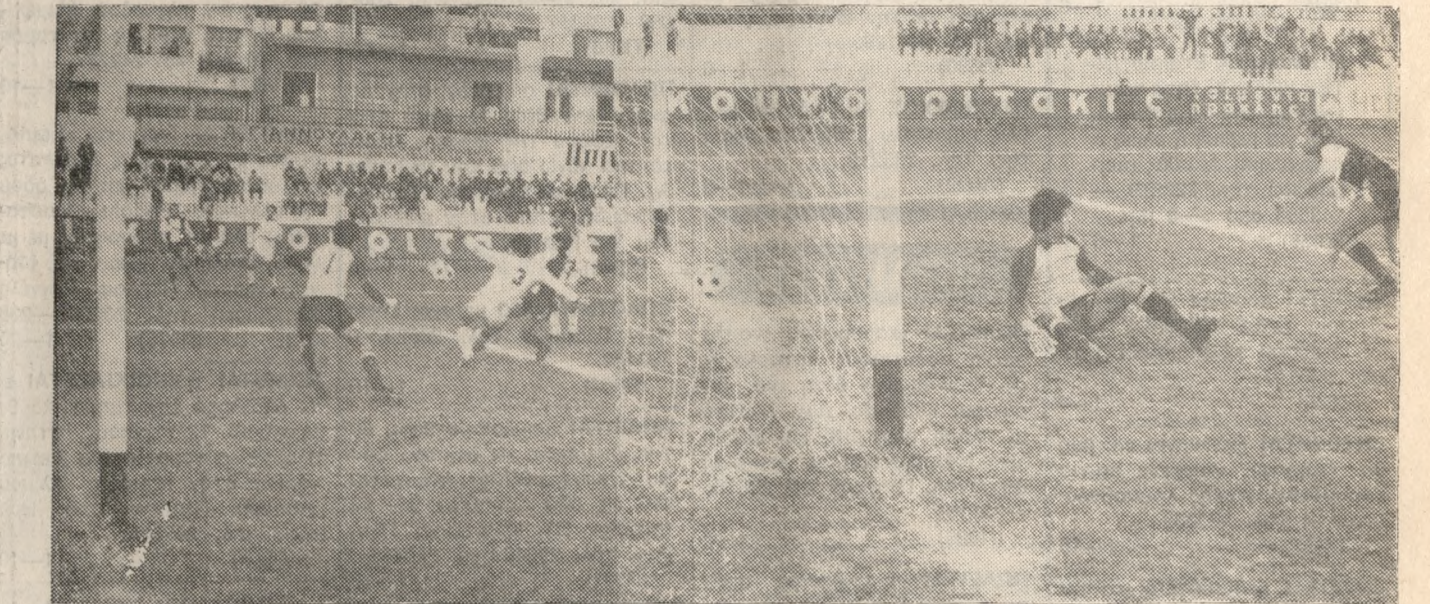
Δύο από τα έξι γκολ που πέτυχε ο ΟΦΗ. Αριστερά το γκολ του Χανταμπάκη και δεξιά το δεύτερο από τα γκολ που πέτυχε ο Θεολής Τσιριμώκος με κεφαλή.

Από τους παίκτες ξεχώρισαν ιδιαίτερα ο Σπυρακάκης Γ. Ε. γύλ πολύ καλά αγωνιστικά, πήγαν και οι Μπολέτης και Λυδάκης. Το σκορ ανά τετράλεπτο: 8—5, 16—11, 26—18, ημίχρονο.