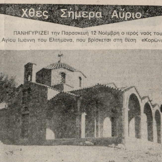
Μαγάρω. Αύριο Πέμπτη θα γίνει Εσπερινός στις 4.30 το απόγευμα, ενώ την ημέρα της εορτής ο Όρθρος θα αρχίσει στις 7 το πρωί και στη συνέχεια η Θεία Λειτουργία.

ΔΕΝ σφινδιδιάθηκαν βέβαια οι Ηρακλιώτες που άκουσαν χθες τις σερίνες να ηχούν. Και δεν σφινδιδιάθηκαν γιατί είχε γίνει πλήρης ενημέρωση ότι θα γινόταν αυτό για δοκιμαστικούς λόγους. Παρά ταύτα πολλοί ήταν εκείνοι που ανατήρησαν στο άκουσμα της σερίνας, κυρίως βέβαια όσοι είχαν πικρή πείρα από την περίοδο της Κατοχής. Ας ευχηθούμε κάθε φορά που θα ηχούν οι σερίνες να είναι για δοκιμαστικούς λόγους, όπως χθες.