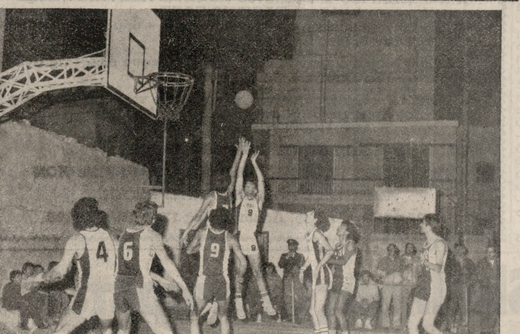
Ένα στιγμιότυπο από τη συνάντηση ΟΦΗ - Ο.Α. Χανίων.