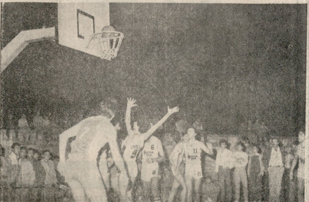
Από τη συνάντηση 'Εργοτέλη — Τρίτωνας για το πρωτάθλημα μπάσκετ Β' Εθνικής.

Σημ.: Α.Ο. Αγ. Δημητρίου, Ηλιοπούλη, 'Ηρασιός, Ρέθυμιον, Ασπίρ Ρ. έχουν από 2 αγώνες