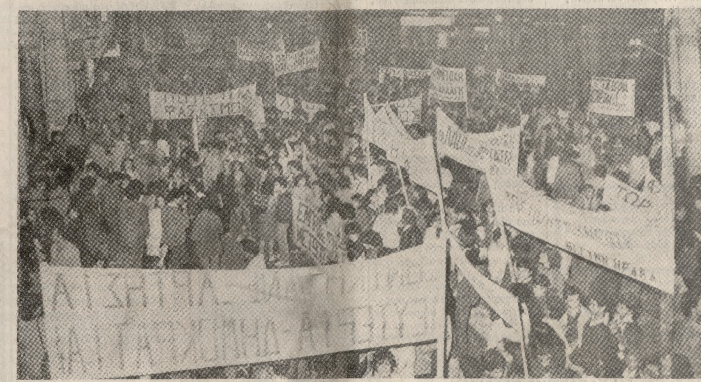
Κινηματός να υλοποιηθούν τα συνθήματα αυτά: — Να φύγει η χώρα μας από κτων Υπαλλήλων του Υπουργ. Γεωργίας Αν. Κρήτης, Ένωση Ελλήνων Φυσικών, Ένωση φίλο παιδείας, ΠΑΣΚ Δασκάλων-Νηπιαγωγών κλπ. Τομεακά Γραφεία Εργατουναπ

— Βρισκόμαστε στα 1919. Ο Βενιζέλος τότε αγωνιζόταν στην