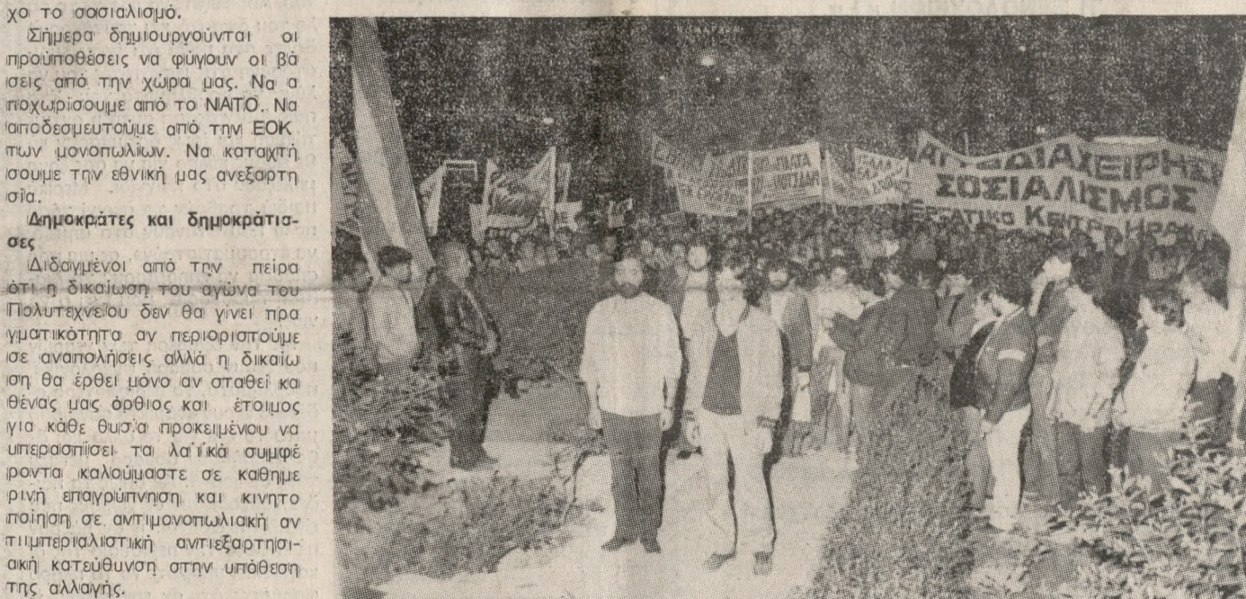
Το ΝΑΤΟ. — Να φύγουν οι ξένες βάσεις — Να αποδομητούμε από την ΕΟΚ των μονοπυλίων. — Να ανακτήσουμε την εθνική μας ανεξαρτησία. — Να διασφαλίσουμε τα κυριαρχικά δικαιώματα της χώρας μας.