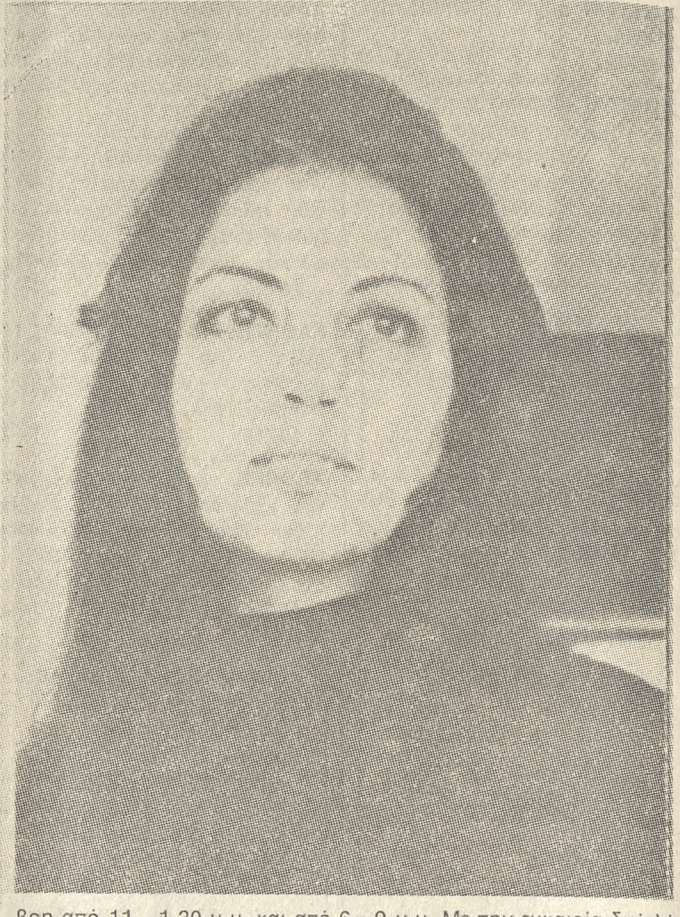
βρη από 11—1,30 μ.μ. και από 6—9 μ.μ. Με τήν ευκαιρία δυο λόγια για τή δουλειά τής — στο κλαίο βλόμετο τή ζωγράφου — όπως τά βρήκαμε στην «Καθημερινή»: «...Μια ποιητική δίχως ίχνος αφηγηματικότητας προβολή τού ανθρωπίνου σώματος ειδικόμενου έτσι ώστε και μετ' από ορισμένα μέλη τού να υποβάλει συνειρημικά και τήν οργανική και ψυχική υπόσταση τού». Ν. ΡΟΓΚΑΝ. «...Αυτή η ακινησία των όγκων με τά αυστηρά περιγράμματα εξασφαλίζουν κόποιες ρευστές γραμμές από τής χάντρες ενός κολιέ ή τήν κίνηση ενός αέρινου διάφανου υφάσματος». Β. ΣΠΗΛΙΑΔΗ

ΛΑΔΙΑ — 35 τόν αριθμό — τής ΥΒΟΝΝΗΣ ΣΥΡΜΟΠΟΥΛΟΥ παρουσιάζονται από τήν Τετάρτη στην Αίθουσα Τέχνης Ηρακλείου Οι φιλότεχνοι θα μπορούν να τά δούν ως τις 6 τού Δεκέμ