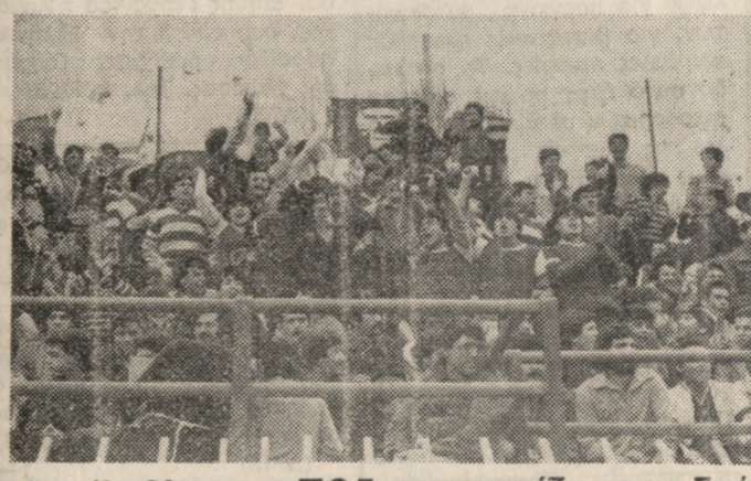
Οι φιλάθλοι του ΠΟΑ πανηγυρίζουν το δεύτερο γκολ της ομάδας τους, που εδραϊώσε τη νίκη.

ΤΟ Κρητικό και δη τοπικό ντέρμπυ μεταξύ ΠΟΑ και Εργοτέλη, για το πρώτο τάβλημα Εθνικής Ερασιτεχνικής Κατηγορίας, έληξε με νίκη της ομάδας του Ατσαλένιου (2-0). Τώρα ο ΠΟΑ καμαρώνει μόνος πρώτος σε αναπάντεη τον άερα της κορυφής. Ο Εργοτέλης κατρακύλησε στην ενατη θέση. Από την άλλη πλευρά ο Ποσειδάωνας, με την μεγάλη νίκη του επί του Ρεθύμνου (4-0) σκαρφάλωσε στην τρίτη θέση του βαθμολογικού πίνακα. Βέβαια, όπως γράψαμε και στο προηγούμενο φύλλο μας, το πρωτάβλημα θα είναι ένας σκληρός μαρζαβώνιος, αλλά όλα δείχνουν ότι οι ομάδες μας έχουν τα φόντα να «κτυπήσουν» τον τίτλο.