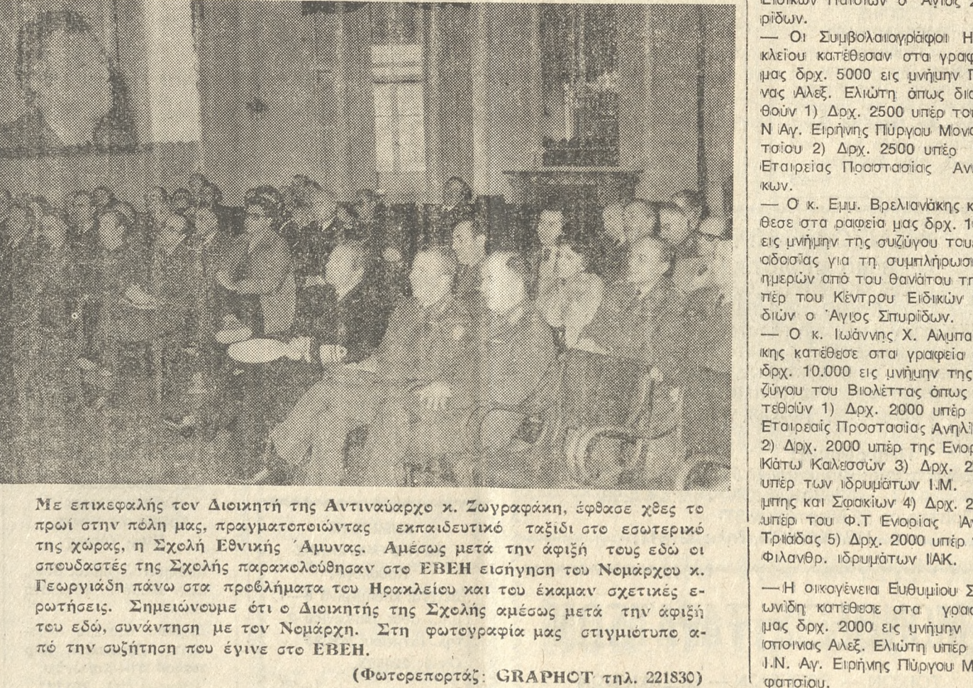
Με επικεφαλής τον Διοικητή της Αντιναύαρχο κ. Ζωγραφάκη, έφθασε χθες το πρωί στην πόλη μας, πραγματοποιώντας εκπαιδευτικό ταξίδι στο εσωτερικό της χώρας, η Σχολή Εθνικής Άμυνας. Αμέσως μετά την άφιξη τους εδώ οι σπουδαστές της Σχολής παρακολούθησαν στο ΕΒΕΗ εισήγηση του Νεμάρκου κ. Γεωργιάδη πάνω στα προβλήματα του Ηρακλείου και του έκαναν σχετικές ερωτήσεις. Σημειώνουμε ότι ο Διοικητής της Σχολής αμέσως μετά την άφιξη τους εδώ, συνάντησε με τον Νεμάρκη. Στη φωτογραφία μας στιγμιότυπο από την συζήτηση που έγινε στο ΕΒΕΗ.