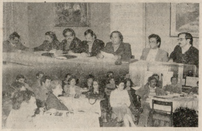
ΤΟ ΠΡΟΒΛΗΜΑ των 1500 ανέργων γεωπόνων — σε άλλη στήλη υπάρχει σχετικό ρεσιτάλ — συζητήθηκε χθες σε ξενοδοχείο της πόλης μας. Στη φωτογραφία μας σχετικό στιγμιότυπο.