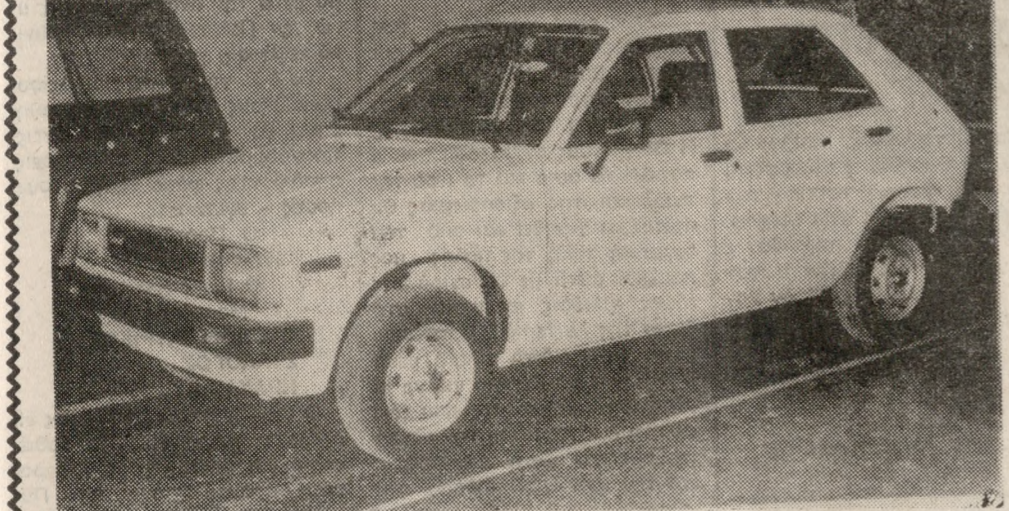
Μην το θαυμάζετε, αποκτήστε το!

Είναι το αυτοκίνητο που απ' την πρώτη ματιά θα σας κατακτήσει. Οι 5 πόρτες του, ο πλεόστος εσωτερικός χώρος, με τα τελευταία καθίσματα, τα ραδιόφωνο, τον πλήρη εξοπλισμό εργαώνων του ταμπλό, τα θερμαινόμενα πίσω καθίσματα, τα φεμά του τζάμια, ο δυνατός και οικονομικός κινητήρας του είναι μερικά από τα πλεονεκτήματά του. Γι' αυτό μόνο θαυμάζομαι μπορείς να το νιώσεις για το ΝΕΟ DAIHATSU CHARADE. Είναι το σωστό οικογενειακό σας αυτοκίνητο. Τώρα έλκει μερείται να το αποκτήσετε. Ακόμα και με ΔΙΑΚΑΝΟΝΙΣΜΟ έως 24 ΜΗΝΩΝ. ΕΓΓΥΗΣΗ - SERVIS - ΑΝΤΑΛΑΚΤΙΚΑ Αποκλειστικοί Αντιπρόσωποι Ν. Ηρακλείου ΕΜΜ. ΜΠΕΛΙΒΑΝΗΣ και ΓΙΟΣ Ο.Ε. Λ. Ικάρου 58 - Τηλ. 287-240