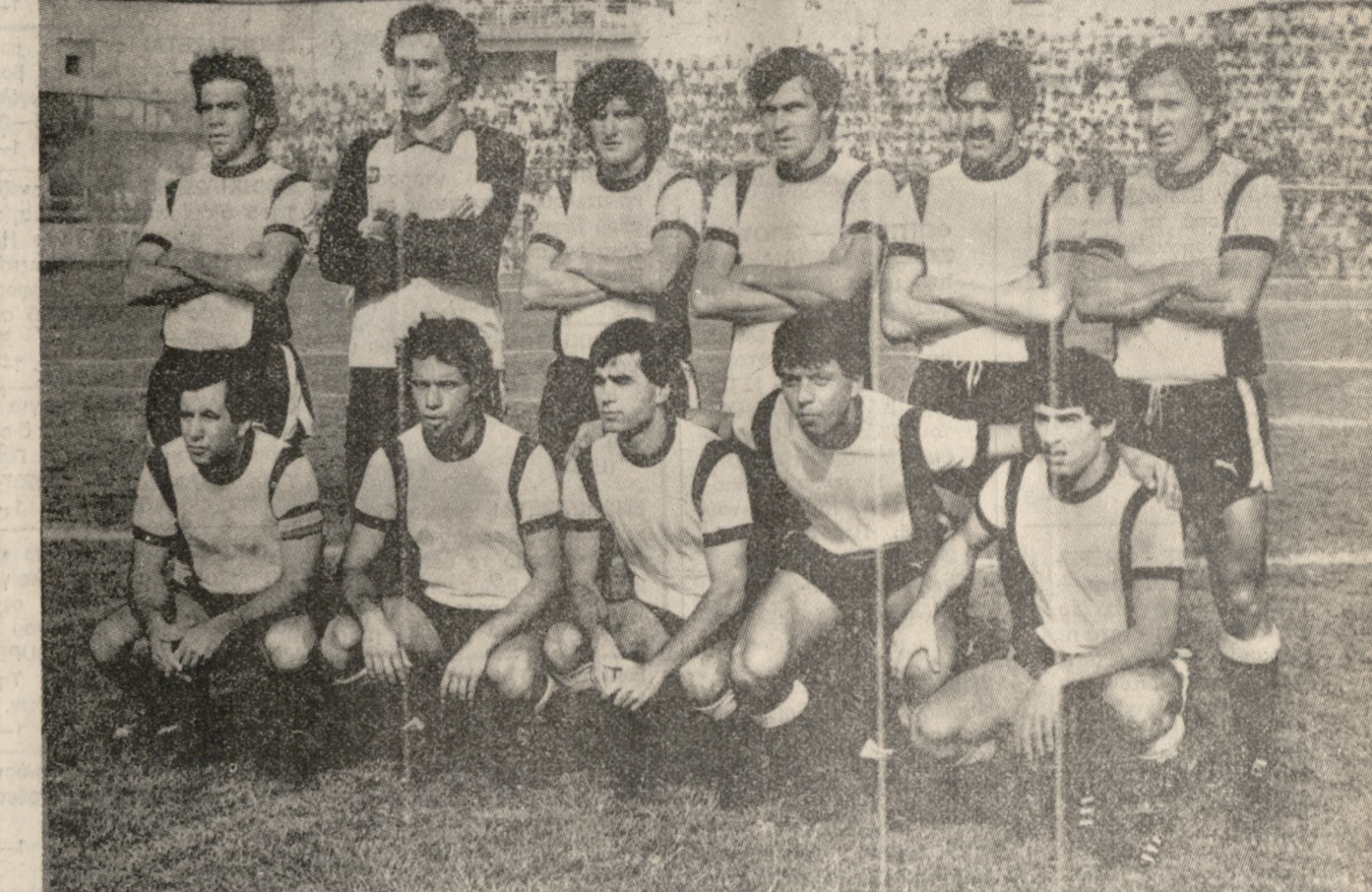
Ο ΟΦΗ, ο οποίος έχει τα φόντα κίτρινα, διαδραματίζει σημαντικό ρόλο στο πρωτάθλημα Α' Εθνικής Κατηγορίας και επεδίωξε να μην έχει το άγχος του υποβιβασμού.