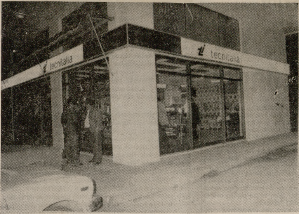
Το νέο Υπεκατάστημα της TECNITALIA στη Λεωφ. Κνωσού 148