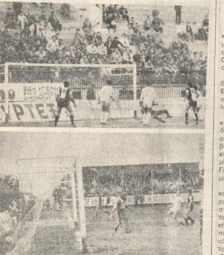
Δύο από τα γκολ που πέτυχε χθές ο Ο.Φ.Η. στον αγώνα που με τον Λεβαδειάκο.