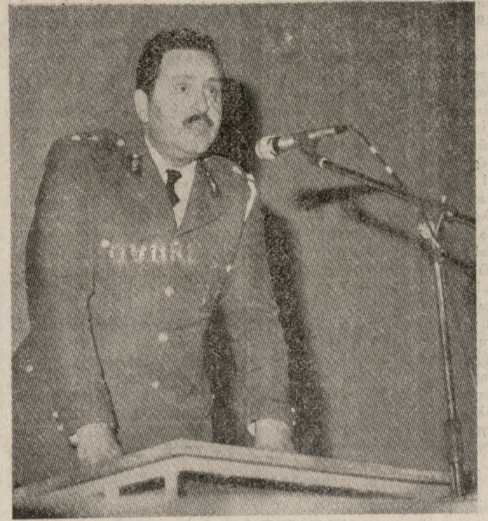
Ο Διοικητής της Τροχαίας κάνει τον απολογισμό δράσης του χώρου του.

Τριάντα οκτώ συνολικά άνδρες που έχασαν τη ζωή τους στο Ηράκλειο σε 28 θανατηφόρα τροχαία το '81 και το '82. Από αυτούς, οι 16 θύματα 12 τροχαίων σκοτώθηκαν το '81, και οι 22 θύματα 16 τροχαίων σκοτώθηκαν στο 11ήμερο του Ιανουαρίου - Νοεμβρίου 1982. Στο ίδιο χρονικό διάστημα 175 άνθρωποι τραυματίστηκαν βαρεια ενώ 747 ελαφρά. Τον τραγικό αυτό απολογισμό σε αίμα, έκοψε χθες σε συγκέντρωση στον «Απέλλωνα» ο Διοικητής της Τροχαίας Ηρακλείου, Ο απολογισμός έγινε στα πλαίσια της γενικότερης ομιλίας που κ. Διοικητή για την κατάσταση που επικρατεί στον κυκλοφορικό το μέσο του Ηρακλείου, και για τις λύσεις που πρέπει να δοθούν. Στον ίδιο απολογισμό επισή-