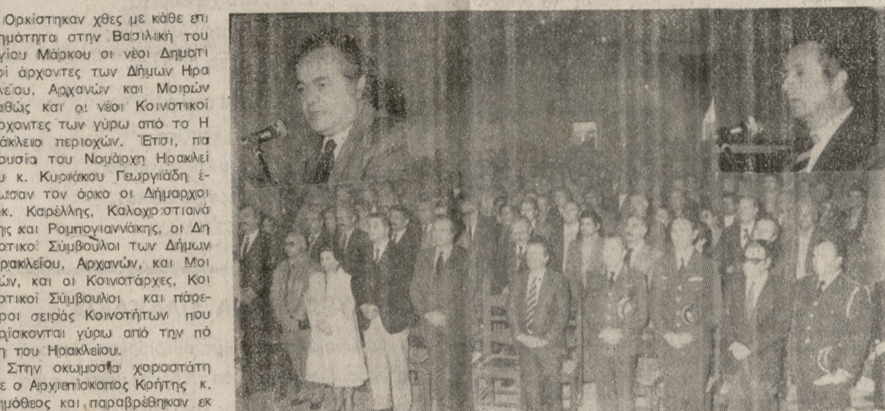
Στιγμιότυπο από την χθεσινή Όρκωμοσία των νέων Δημοτικών και Κοινοτικών Αρχόντων.

ΝΟΜΑΡΧΗΣ: ΤΟΠ. ΑΥΤΟΔΙΟΙΚΗΣΗ ΚΑΙ ΦΟΡΕΙΣ, ΘΑ ΝΙΚΗΣΟΥΝ