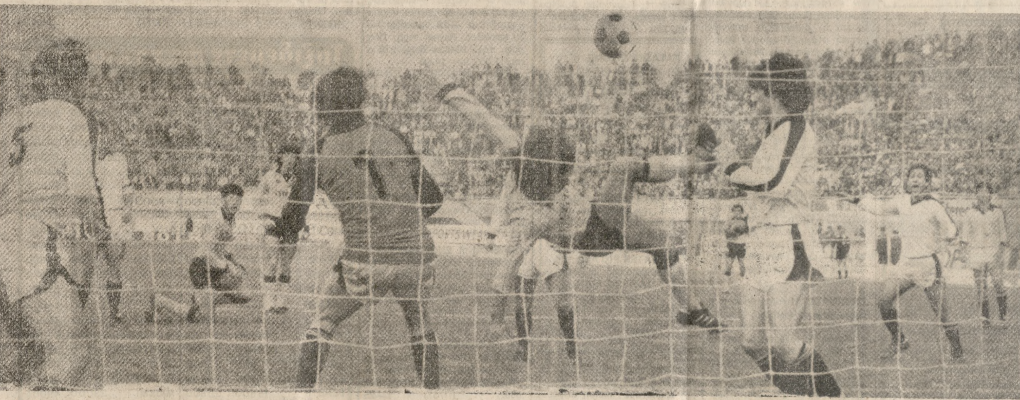
Ο Μαύρος, μόνος και ανενόχλητος, προσπαθεί να «πιάσει» ψαλίδι για να παραβιάσει την εστία του Ο.Φ.Η. Στη φάση αυτή οι Ενωσίτες ζήτησαν πέναλτυ!!! Δεν νομίζουμε ότι χρειάζεται να σχολιάσουμε την απαίτησή τους αυτή, η οποία σίγουρα τους εκθέτει. Οι άνθρωποι παραλογίστηκαν εξ αιτίας της βαριάς ήττας τους.