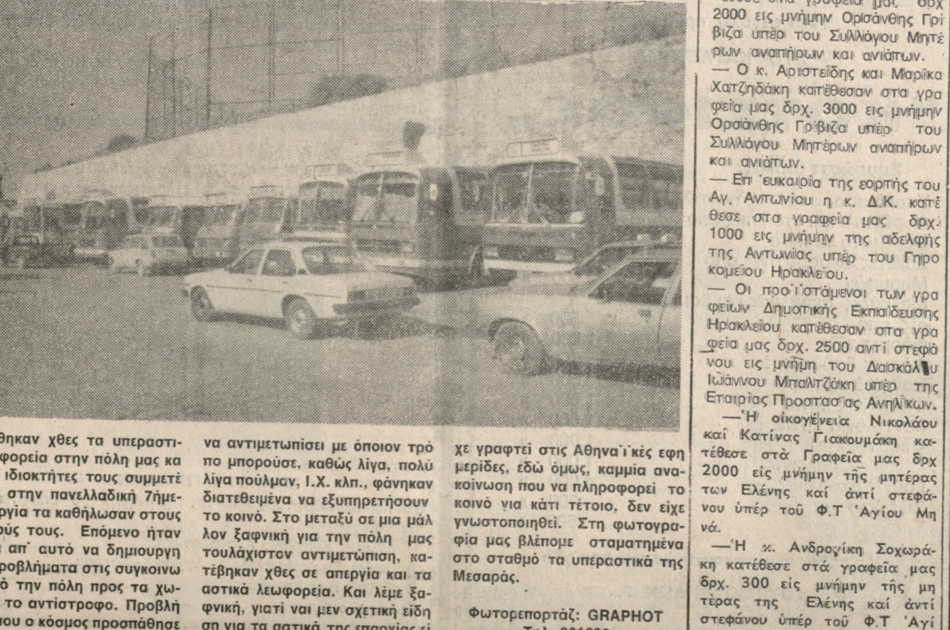
Νεκρώθηκαν χτες τα υπεραστικά λεωφορεία στην πόλη μας καθώς οι ιδιοκτήτες τους συμμετέχοντες στην πανελλαδική 7ήμερη απεργία τα καθήλωναν στους σταθμούς τους. Επόμενος ήταν ύστερα απ' αυτό να δημιουργηθούν προβλήματα στις συγκοινωνίες από την πόλη προς τα χωριά και το αντίστροφο. Προβλήματα, που ο κόσμος προσπάθεται να αντιμετωπίσει με όποιον τρόπο μπορούσε, καθώς λίγα, πολύ λίγα ποσά, Ι.Χ. κλπ., φέρονται διατεθειμένα να εξυπηρετήσουν το κοινό. Στο μεταξύ σε μια μάχη 48ωρη για την πόλη μας τουλάχιστον αντιμετώπιση, κατήχησαν χτες σε απεργία και τα αστικά λεωφορεία. Και λέμε ζαφνικά, γιατί για μεν σχετικά είδηση για τα αστικά της επαρχίας