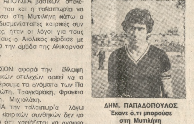
ΔΗΜ. ΠΑΠΑΔΟΠΟΥΛΟΣ Έκανε 0:1,τι μπορούσε στη Μυτιλήνη

Η ΑΠΟΥΣΙΑ βασικών στελεχών του και η ταλαιπωρία να φτάσει στη Μυτιλήνη ήταν οι δύο διαμετρώστες αιτίες της ήττας, ήταν οι λόγοι για τους οποίους ο Αιολικός κέρδισε με 3-0 την ομάδα της Αλικαρνασσού. ΙΟΣΟΝ αφορά την ελλειψη βασικών στελεχών αρκεί να αναφέρουμε τα ονόματα των Πατηνίτη, Τσαχαράκη, Φραγκιαδάκη, Μιχαλακή. ΠΙΑ την ταλαιπωρία λόγω των μαρικών συνθηκών δεν νομίζω ότι χρειάζεται να αναφερθεί κανείς σε λεπτομέρειες. Οι γηπεδούχοι παρωτρυνόμενοι από τους φιλάθλους τους πήραν στο α' ημίχρονο την πρωτοβουλία των κινήσεων και στο 30' κατέφεραν να προηγήθούν στο σκόρ. Ο Μανουσίος έκανε σέντρα από δεξιά και ο Καλαμιδιώτης με κεφαλιά πάσα βίωσε την εστία του Γιαμαλάκη. ΑΝΤΙΘΕΤΑ οι γηπεδούχοι στο 70ο λεπτό πάτησαν ένα σ' ήδη γκολ με τον Καλαμιδιώτη μετά από εξυπνη «πύρισμα» του Μανουσίου. Ο ΟΦΗ καλεί τα μέλη τους μετάρχους και τους φιλάθλους του που θα γίνει στο κέντρο Χιμητηράκη την Παρασκευή 28-1-83 και ώρα 9.30. Προσκήσεις διατίθενται από τα γραφεία του ΟΦΗ. Εκ του Δ.Σ. ΟΦΗ