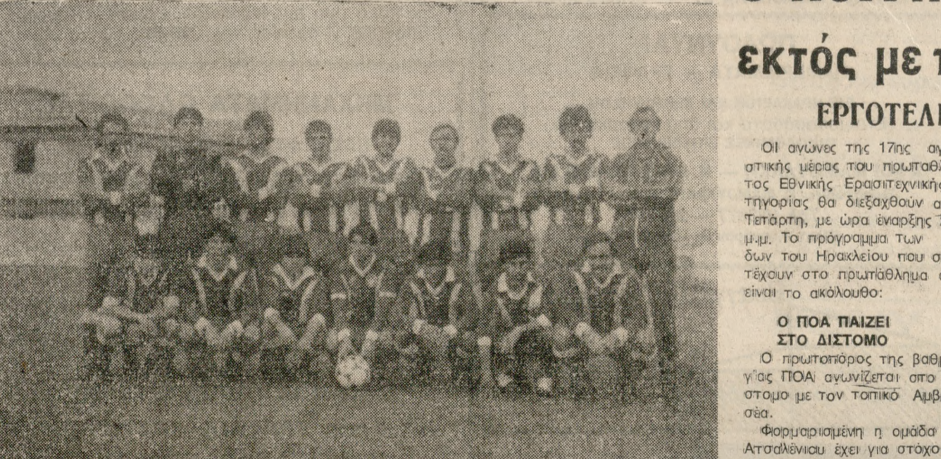
Η ομάδα του ΠΟΑ η οποία έχει φέτος πολλές επιτυχίες στο ενεργητικό της και «χτυπάει» με αξιώσεις την άνοδο στην παραπάνω κατηγορία.