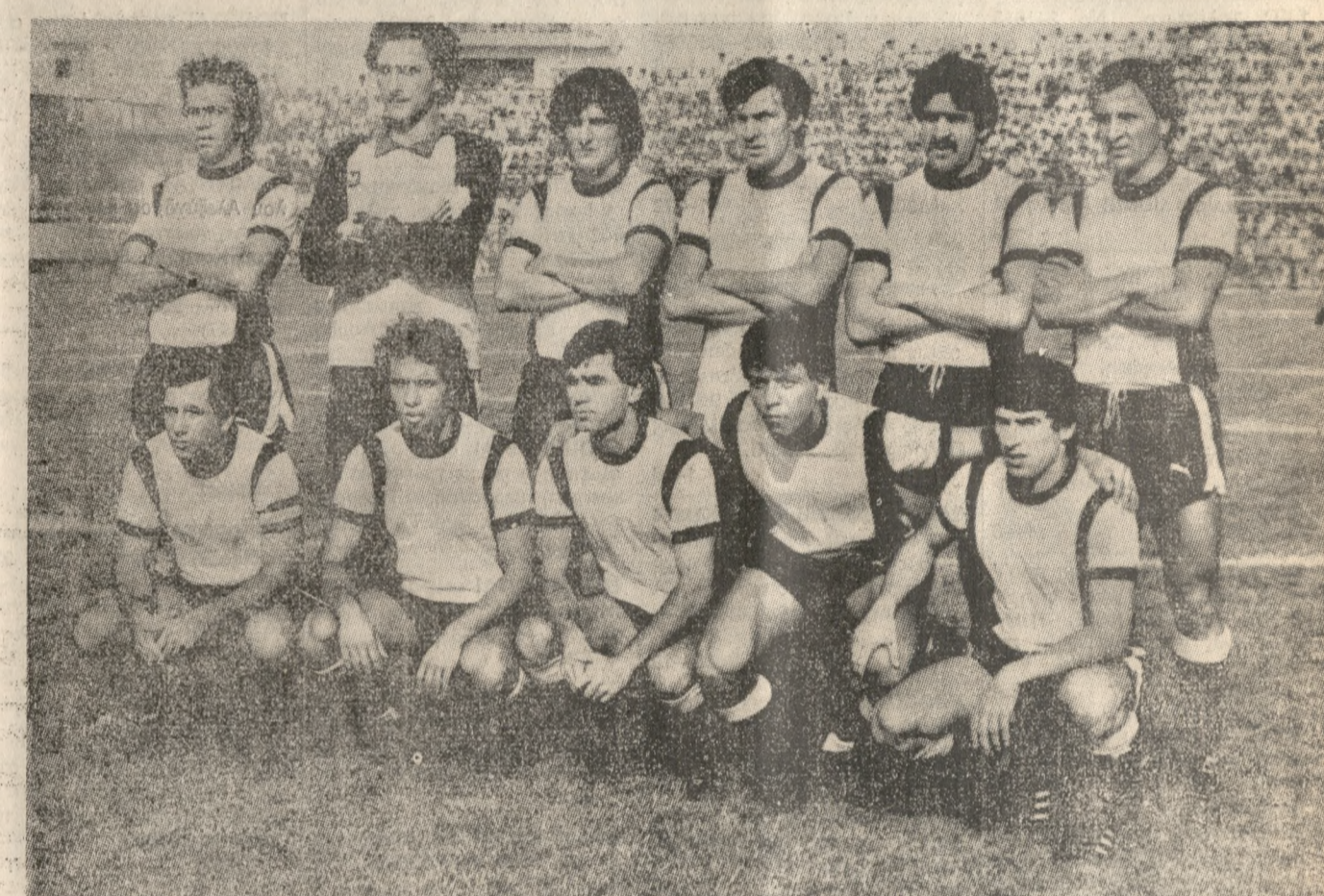
Ένας από τους λόγους που ο ΟΦΗ είναι φέτος ομάδα... ασανσέρ, είναι και το ότι λόγω τραυματισμών ή τιμωριών δεν παίζει συνέχεια με την ίδια 11άδα. Αν δει κανείς την παραπάνω φωτογραφία θα καταλάβει πως αλλάζει κάθε φορά το σχήμα της 11άδας του ΟΦΗ. Αυτοί βέβαια είναι αστάθμητοι παράγοντες.