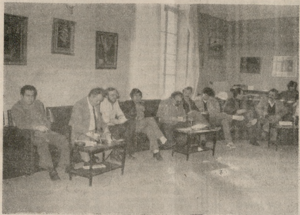
Στιγμιότυπο από τη χθεσινή σύσκεψη της Τ.Ε. για το Π.Κ.