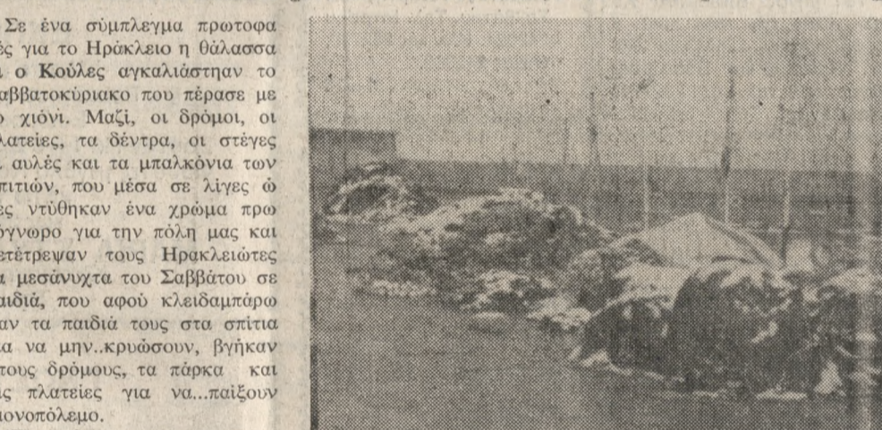
Σύμπλεγμα πρωτοφανές για το Ηράκλειο: Ο Κούλες, η θάλασσα, αγκαλιά με το χιόνι...

Αν όμως για την πόλη του Ηρακλείου και τους Ηρακλειώτες ήταν ένα γεγονός χαράς, δεν συνέβη το ίδιο και για την ύπαιθρο που αποκλειστικά και διαίτερα για βοσκούς και τα ζώα τους που κινδύνωναν.