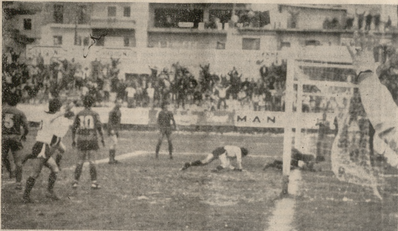
Ο Τασσόπουλος έχει στείλει τη μπάλλα στα δίχτυα και το 1-0 υπέρ του ΟΦΗ είναι γεγονός. Η χαρά για το γκολ αυτό θα διαρκέσει μόνο 15 λεπτά.