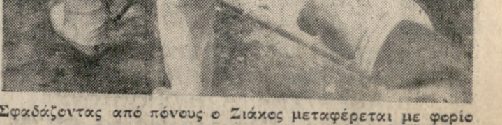
Σφραδίζοντας από πένους ο Ζιάκος μεταφέρεται με φορτίο εκτός αγωνιστικού χώρου.