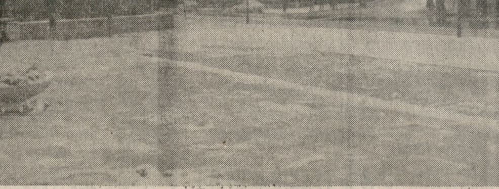
Πάρκα, πλατείες, δρόμοι, στέγες, τα πάντα στο Ηράκλειο ντύθηκαν το Σάββατο-κυριακή ένα πρωτόγνωρο χρώμα: Το άσπρο του χιονιού...

Οι αρμόδιες Υπηρεσίες της Νομαρχίας έχουν επιληφθεί για να εκμηδύνουν τις ενδεχόμενες ζημιές στην καλλιέργεια και στην κτηνοτροφία.