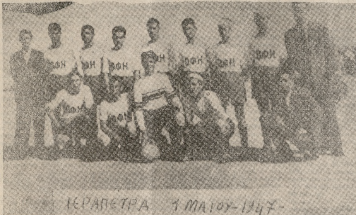
ΙΕΡΑΠΕΤΡΑ 1 ΜΑΙΟΥ-1947-