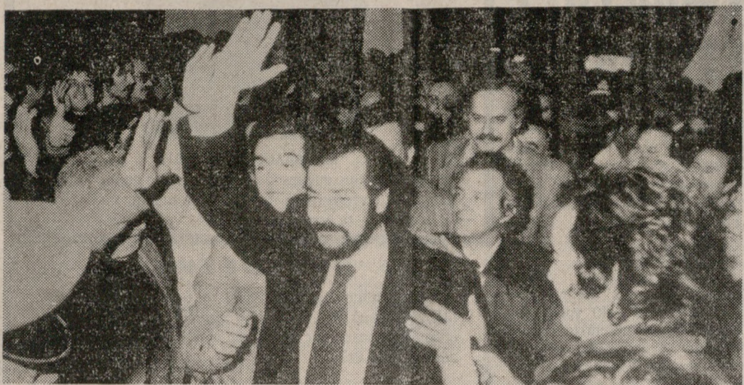
Την πορεία της χώρας στους 16 μήνες διακυβέρνησής της από το ΠΑΣΟΚ ανέλυσε χθες ο Υπουργός Εσωτερικών κ. Γ. Γεννηματάς. Στη φωτογραφία μας στιγμιότυπο από την συγκέντρωση.