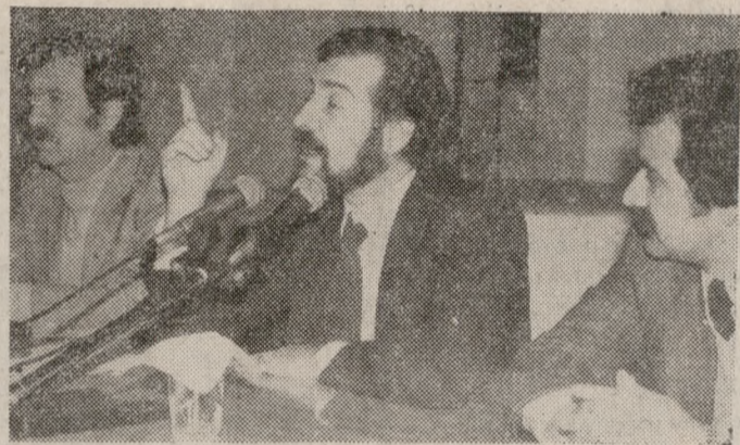
Στον Ασό στηρίχτηκε και σ' αυτόν στηρίχθηκε, δήλωσε χθες σε μεγάλη συγκέντρωση ο Υπουργός Εσωτερικών κ. Γεννηματάς. Το κλίμα με μιά στιγμή της χθεσινής εκδήλωσης.

Στην Βασιλική του Αγ. Μάρκου και μπροστά σ' ένα πλήθος που δημιουργούσε το αδιαχώρητο, ο Υπουργός Εσωτερικών κ. Γ. Γεννηματάς, μίλησε χθες το βράδυ για την πορεία της χώρας στους 16 μήνες διακυβέρνησής της από το ΠΑΣΟΚ. Η ομιλία έγινε στα πλαίσια της ενημέρωσης που γίνεται από το νήμα σ' όλη τη χώρα για τους «16 μήνες ΠΑΣΟΚ».