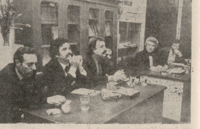
Στη φωτογραφία μας ένα στιγμιότυπο από τη σύσκεψη που όπως είναι γνωστό, οργάνωσε ο Πολιτιστικός Σύλλογος Κορινθίων.

ΠΩΣ ΘΑ ΝΤΥΘΕΙΣ Γιάγρο; τον ρωτούσε χθες συντάκτης μας... «Μα φυσικά... αυθαίρετα» ήταν η άμεση απάντηση. (Γέλιο πάντως, είχαμε μάθει, πως είχε ντυθεί... ΠΑΣΟΚ). ΜΕ ΕΠΙΤΥΧΙΑ πραγματοποιήθηκε την Τρίτη το βράδυ στα Κορίνθια η σύσκεψη των κατοίκων και των εκπαιδευμένων του Δήμου για τα προβλήματα του προαστίου.