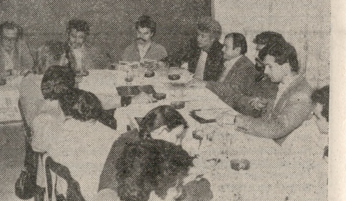
Αυτό σημαίνει ότι θα επανέλθουμε. Για την ώρα απλά μεταφέρουμε το μήνυμα των καλλιτεχνών: «...Δεκατρία τραγούδια για τους κομμάτι και τις χαμένες αξίες του τόπου μας. Η ανάγκη και το μήνυμά της εποχής: αποκέντρωση...». «Γιατί, οι πόλεις τείνουν — κατά πως είπε ο Λάζος Παπαδόπουλος — να εξοριάζονται με το άναρχο κατασκευαστικό της Αθήνας...». Το πόσο το μήνυμά δεν μένει μόνο φραστικό, όχι τώρα...

Λέμε «τους» και όχι και «μας» γιατί θάταν λάθος να σταθούμε κριτικά απέναντι σε μια δουλειά που δεν μας έμεινε καιρός να σκούσουμε στον δικό μας τον χώρο, και στον δικό μας τον χρόνο. (Σ.σ.: Μιλάμε για χώρο και χρόνο γιατί στάθηκαν πολύ σ' αυτόν οι δημιουργοί του δίσκου).