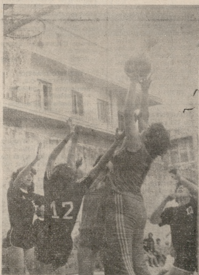
ΟΦΗ—ΓΕΗ στο Γυναικείο πρωτάθλημα: διεκδίκηση της μπάλας κάτω από τo καλάθι του ΟΦΗ.