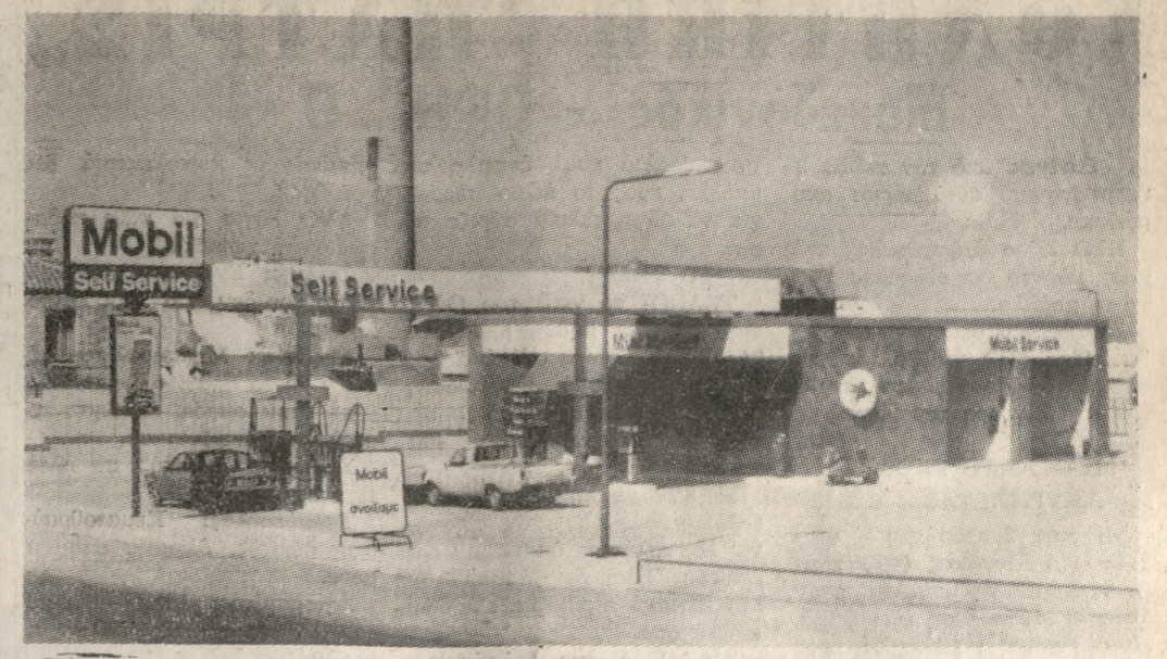
ΕΝΑ ΝΕΟ ΥΠΕΡΣΥΓΧΡΟΝΟ ΠΡΑΤΗΡΙΟ ΥΓΡΩΝ ΚΑΥΣΙΜΩΝ

ΑΘΑΝΑΣΙΑΔΗΣ Χειρουργός Ὀφθαλμίατρος Μετακινούμενος εἰς Ἀγ. Νικόλαο 8 Κολωνάκι (Ἀθῆνα) Τηλ. 3631265. 2ος Μερῆρας 19 Πασό Λυμῶν (Παλαιός) Τηλ. 4115580.