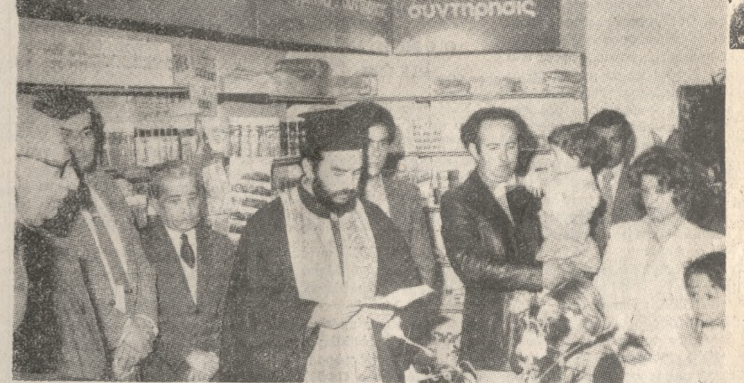
Πράγματι αποτελεῖ καὶ καὶ τὴν ἀποδοτικότητα τῆς νέας συσκευῆς. Συγχαίρονται οἱ ἐπιχειρηματίες καὶ οἱ πελάτες. Στὴν ἐπάνω φωτογραφία ἐξυπηρετοῦνται οἱ πελάτες τοῦ Πρατηρίου καὶ στὴν κάτω στιγμιότυπο ἀπὸ τὰ ἐγκαίνια, σε φωτογραφίαν ΚΟΥΛΑΤΣΟΓΛΟΥ, Τηλ. 282934.