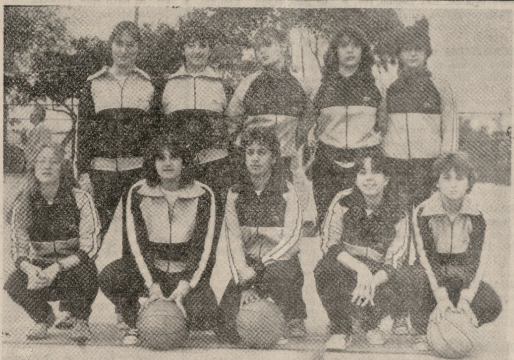
Τα κορίτσια του «Ηράκλειο Ο.Α.Α.»