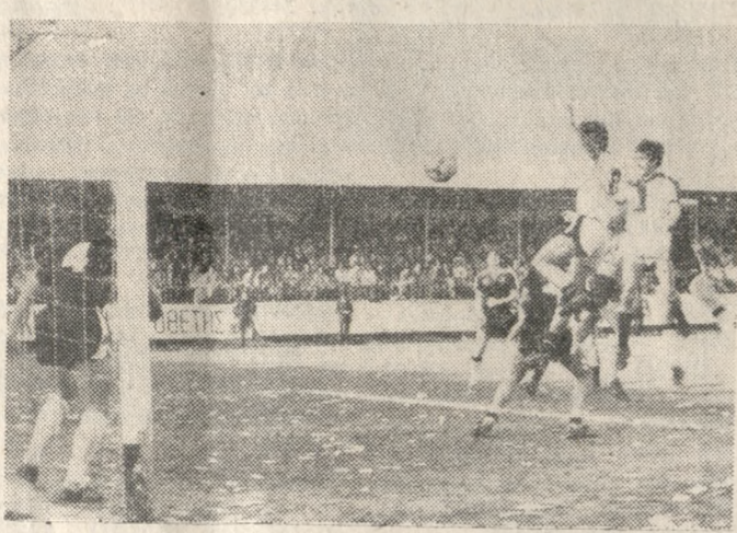
Ο Αγιωματίτης έχει «πίσει» κεφαλιά και η μπάλλα πήρε ήδη πορεία προς τα δίχτυα. Η ισοφάριση για τον ΟΦΗ είναι γεγονός.

ΕΝΑ μπάσιμο έκανε στο 81' ο Ιορτανάκης και από το ύψος της περιοχής του ΠΑΟΚ σούταρε. Ο εντός αυτής ευρισκόμενος Αποστόλης της γλάφυρε πορεία με το χέρι. Το πέναλτι ήταν κλασικό και ο διαιτητής κ. Κολοκούβης το έδειξε