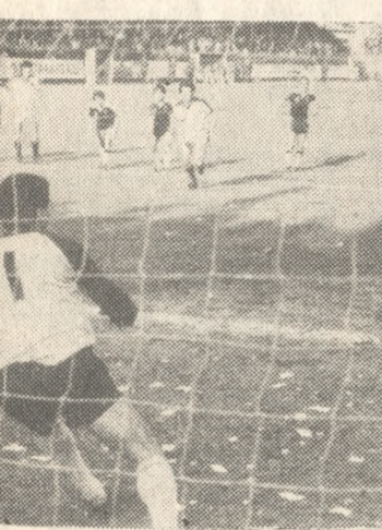
Με άψοφο στόλ ο Κίριος ξεγελά το Φορτούλα και κάνει το σκορ 2-1.

ΕΝΑ μπάσιμο έκανε στο 81' ο Ιορτανάκης και από το ύψος της περιοχής του ΠΑΟΚ σούταρε. Ο εντός αυτής ευρισκόμενος Αποστόλης της γλάφυρε πορεία με το χέρι. Το πέναλτι ήταν κλασικό και ο διαιτητής κ. Κολοκούβης το έδειξε