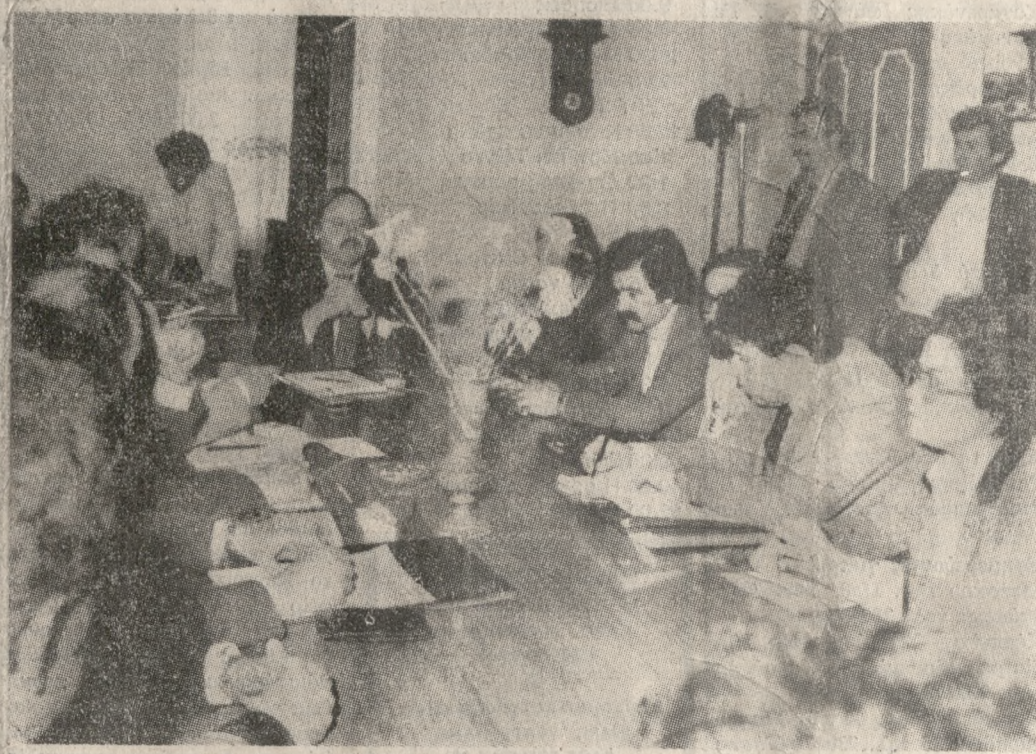
Ένα στιγμιότυπο από τη σύσκεψη που έγινε χτες στη Νομαρχία για τα κυκλοφοριακά - συγκοινωνιακά προβλήματα.