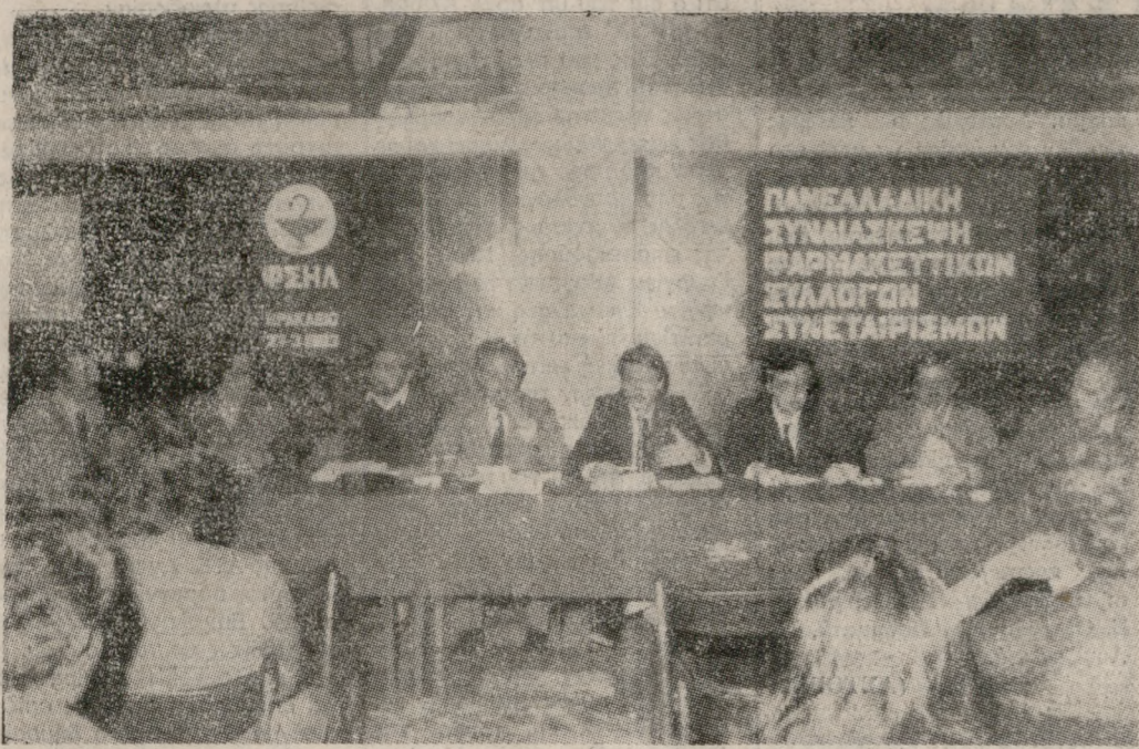
Το προεδρείο της Πανελλαδικής Συνδιάσκεψης Φαρμακευτικών Συλλόγων Συνεταιρισμών, που πραγματοποιήθηκε την Κυριακή στην πόλη μας.