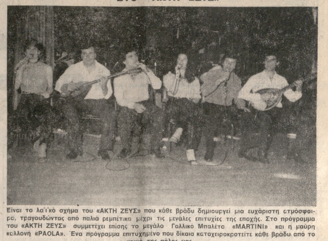
Είναι το λαϊκό σήμα του «ΑΚΤΗ ΖΕΥS» που κάθε βράδυ δημιουργεί μια ευχάριστη ατμόσφαιρα, τραγουδώντας από παλιά ρεμπέτικα μέχρι τις μεγάλες επιτυχίες της εποχής. Στο πρόγραμμα του «ΑΚΤΗ ΖΕΥS» συμμετέχει επίσης το μεγάλο Γαλλικό Μπαλέτο «MARTINI» και η μαύρη κελωνή «PAOLA». Ένα πρόγραμμα επιτυχημένο που δίκαια καταχειροκροτείται κάθε βράδυ από το κοινό της πόλης μας.

ΕΝΟΙΚΙΑΖΕΤΑΙ διαμέρισμα 1 σόγειο 4 δωματίων εις Αγ. Ιωάννη τηλ. 284768-231449. (Ε296) 1-6