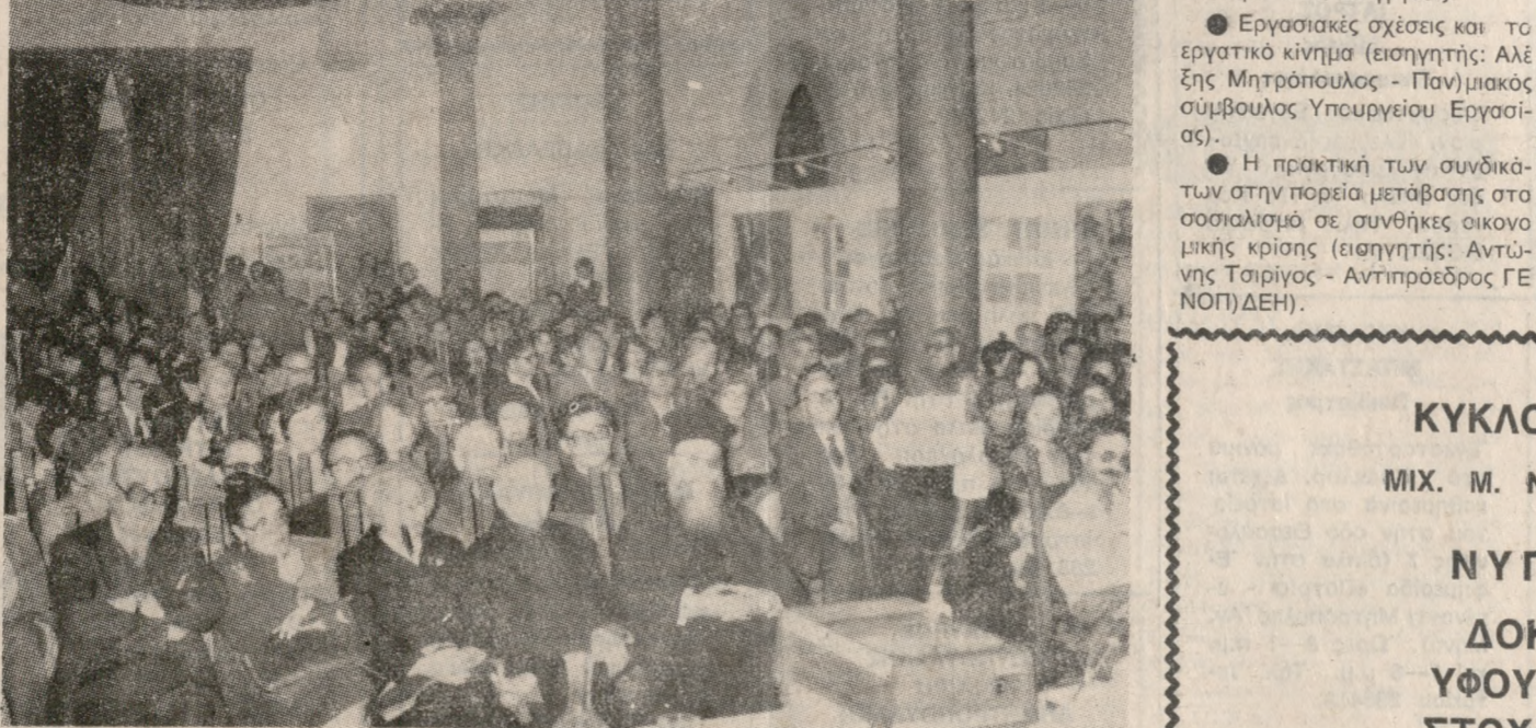
Στην τρίτη και τελευταία μέρα του προχωρά το πολιτιστικό τριήμερο με θέμα «Η σύγχρονη επιστήμη και το αύριο του ανθρώπου», που οργάνωσε εδώ η ΕΛΜΕ και το Παν/μιο Κρήτης. Στη φωτογραφία μας, μια εικόνα από την πρώτη μέρα του τριήμερου. Μία εικόνα που δείχνει, πως πολλοί Ηρακλιώτες ενδιαφέρονται για την επιστήμη και το αύριο του ανθρώπου.