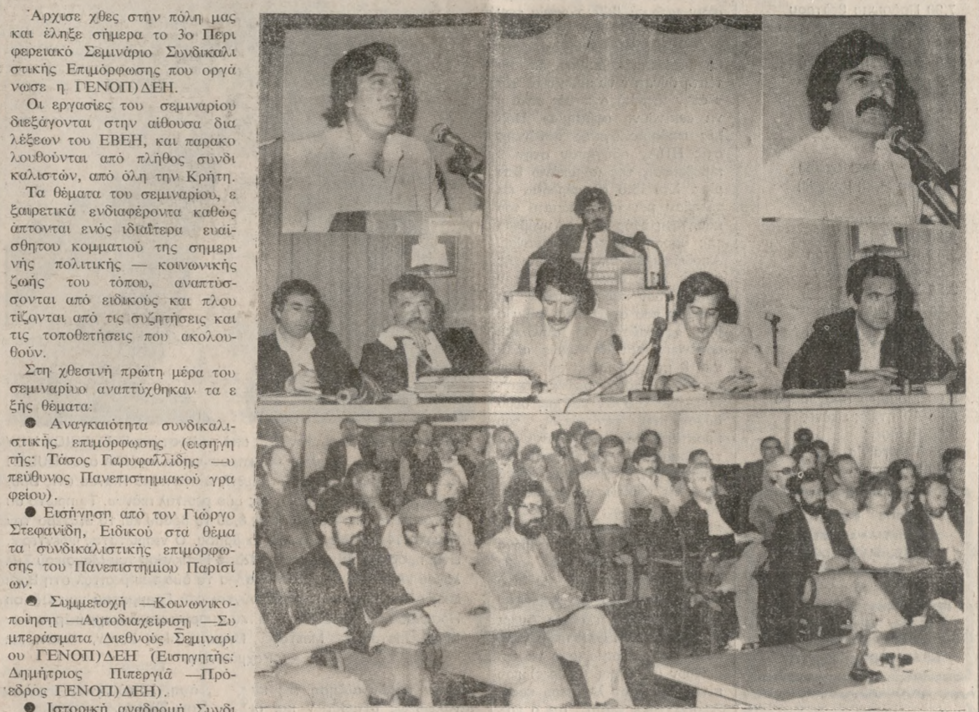
Με πολύ ενδιαφέρον παρακολουθείται από συνδικαλιστές όλης της Κρήτης το 3ο Περιφερειακό Σεμινάριο Συνδικαλιστικής Επιμόρφωσης που οργάνωσε η ΓΕΝΟΠ.ΔΕΗ. Στη φωτογραφία μας, ένα στιγμιότυπο από την χθεσινή πρώτη μέρα στο ΕΒΕΗ.