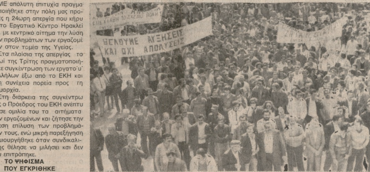
Συγκέντρωση έξω από τον Νομαρχιακό των απεργών, προχθές το πρωί.

ΜΕ απόλυτη επιτυχία πραγματοποιήθηκε στην πόλη μας προχθές η 24ωρη απεργία που κήρυξε το Εργατικό Κέντρο Ηρακλείου, με κεντρικό αίτημα την λύση των προβλημάτων των εργαζομένων στον τομέα της Υγείας. Στα πλαίσια της απεργίας το πρωί της Τρίτης πραγματοποιήθηκε συγκέντρωση των εργαζομένων παλλήλων έξω από το ΕΚΗ και στη συνέχεια πορεία προς τη Νομαρχία. Στη διάρκεια της συγκέντρωσης ο Πρόεδρος του ΕΚΗ ανέπτυξε σε ομιλία του τα αιτήματα των εργαζομένων και ζήτησε την άμεση επίλυση των προβλημάτων τους, ενώ μικρή παρεξήγηση δημιουργήθηκε όταν συνδικαλιστής θέλησε να μιλήσει και δεν του επιτράπηκε. Στη διάρκεια της συγκέντρωσης ο Πρόεδρος του ΕΚΗ ανέπτυξε σε ομιλία του τα αιτήματα των εργαζομένων και ζήτησε την άμεση επίλυση των προβλημάτων τους, ενώ μικρή παρεξήγηση δημιουργήθηκε όταν συνδικαλιστής θέλησε να μιλήσει και δεν του επιτράπηκε. Στη διάρκεια της συγκέντρωσης ο Πρόεδρος του ΕΚΗ ανέπτυξε σε ομιλία του τα αιτήματα των εργαζομένων και ζήτησε την άμεση επίλυση των προβλημάτων τους, ενώ μικρή παρεξήγηση δημιουργήθηκε όταν συνδικαλιστής θέλησε να μιλήσει και δεν του επιτράπηκε.