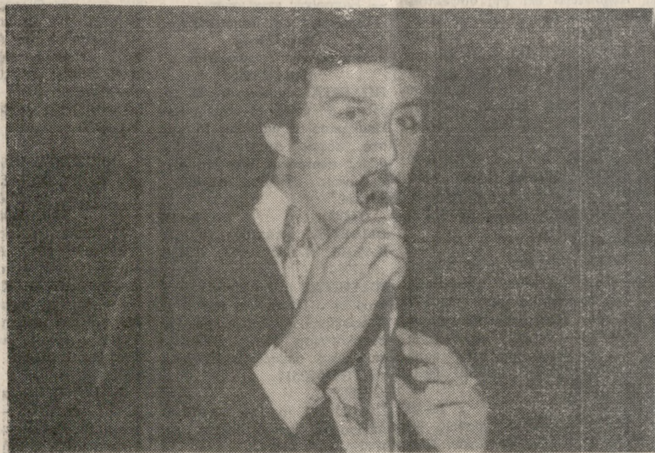
Κάποτε στη Κολούμπια, παρακολουθώντας την εγγραφή ενός δίσκου, άκουσα άθελά μου και μία συζήτηση ανάμεσα σε κάποιον παραγωγό και μια νεαρά τραγουδίστρια.

Ας γίνει μια προσπάθεια να σωθεί η γλώσσα μας «αυτό το όργανο που κατευθύνει πολλές φορές τις έννοιες που εκφράζει περισσότερο, παρά που κατευθύνεται απ' αυτές...» λόγια ξανά παρμένα από τον Οδυσσέα Ελύτη. Τον ποιητή που γράφει... «...ω λινό καλοκαίρι, συνετό φθινόπωρο, χειμώνα ελάχιστε, η ζωή καταβάλλει τον σβολό του φύλλου της ελιάς. Και στη νύχτα μέσα των αφρώνων μ' ένα μικρό τριζόνι κατακυρώνει πάλι το νόμιμο Ανέλιπτο».