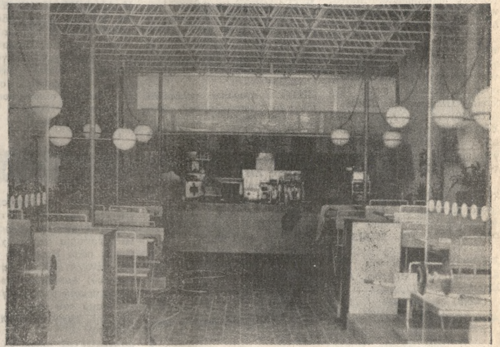
Εικόνα δεύτερη: Το FAST FOOD MR. BURGER στην Λεωφόρο Δημοκρατίας.

Καινούργιο, αστραφτερά καλοφτιαγμένο, και κυρίως ιδανικό του να προσφέρει γρήγορα - γρήγορα φαγητό υψηλής ποιότητας. Αν γεννήσει κόρη, δεν θα θέλει σε καμιά περίπτωση να την ονομάσει Ελένη, καιτοι γι' όνομα στενής συγγένισσας, διότι — λέει — στη Μεσαρά τ' όνομα αυτό θεωρείται γρουσουζίκιο.