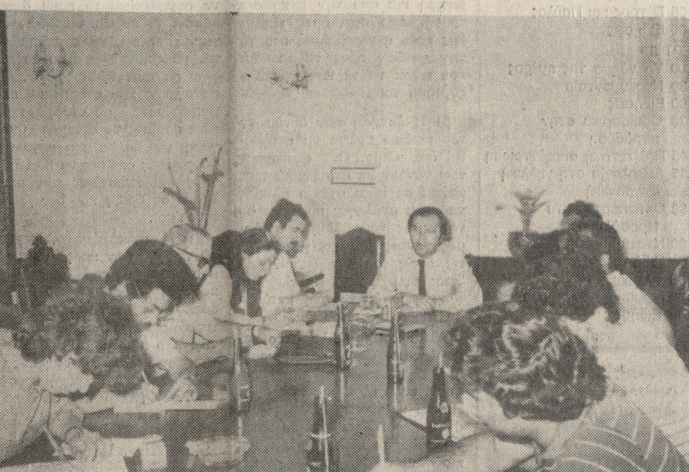
Ο Υφυπουργός Εθν. Οικονομίας κ. Αντ. Γεωργιάδης - αδελφός του Νομάρχη Ηρακλείου - στην χθεσινή συνέντευξη για προβλήματα των υπηρεσιών της αρμοδιότητάς του. Φωτορεπορτάζ: ΓΡΑΦΗΟΤ (Δρέσος - Τρισευαρίνης) 221830

Όταν το αυτοκίνητο τρέχει με 90 χιλιόμετρα και προσκορπιστεί σε εμπόδιο αυτό μέν θα άνηκτοποιηθεί έμεις όμως θα εξακολουθήσουμε να κινούμαστε με 90 χιλιόμετρα και θα προσκορπιστούμε στο αυτοκίνητο που θα παίζει τον ρόλο του εδάφους αλλά με πολύ χειρότερη