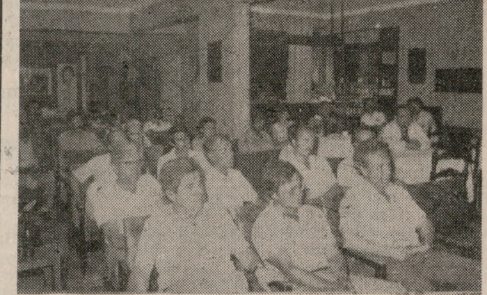
Προσκλήθη ὀτε Ἡρακλείου. Στὴ φωτογραφία μας ὑπᾶλληλο τοῦ ὀτε παρακολουθῶν στὴν αἰθουσα τῆς Λέσχης τῶν τῆς ἐκδήλωσε.

ΜΕ ΕΓΚΑΙΝΙΑ μόνιμης ἐκθεσεῶς πορτραῖτων γνωστῶν Ἑλλῶνων λογοτεχνῶν, με ἐκθεσεῶ βιβλίου καὶ οἰμῶν, τίμησε τὴν πρῶτη ὁμῆνη Δευτέρου στὴν πόλη μας τὴν Μαχρ. τῆς Κρήτης, ἡ Λέσχη