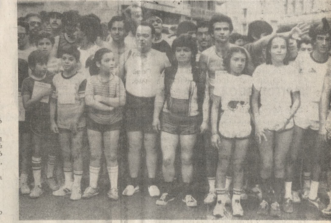
Στιγμιότυπο από την αφητηρία λίγες πριν δοθεί η εκκίνηση του δρόμου «Γύρος Ηρακλείου '83».