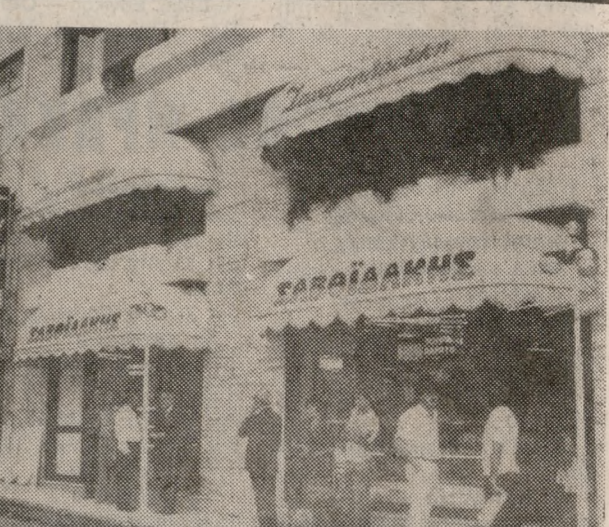
Ενα ακόμα Ζαχαροπλαστικό της γνωστής φήμης ΣΑΒΟΥΔΑΚΗ εγκαινιάστηκε προχθές στην πόλη μας. Το νέο Ζαχαροπλαστικό βρίσκεται απέναντι από τον Άγιο Μηνά.