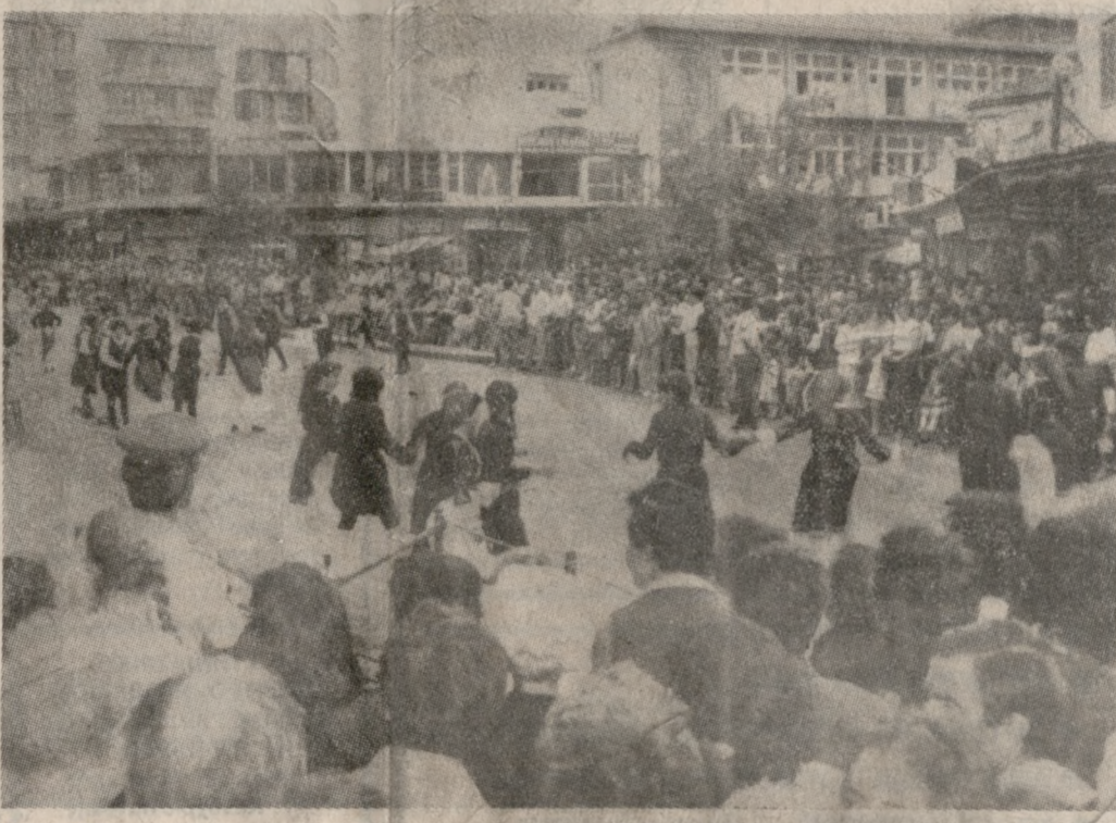
Ένα στιγμιότυπο από την εκδήλωση που έγινε την Κυριακή στην Πλατεία Ελευθερίας Βενιζέλου, στα πλαίσια της 42ης επέτειου της Μάχης της Κρήτης.

Τους δύο άνδρες περισηνίλεξε και μετέφερε σε ασφαλές μέρος πλωτό σκάφος του Κεντρικού Λιμεναρχείου Ηρακλείου.