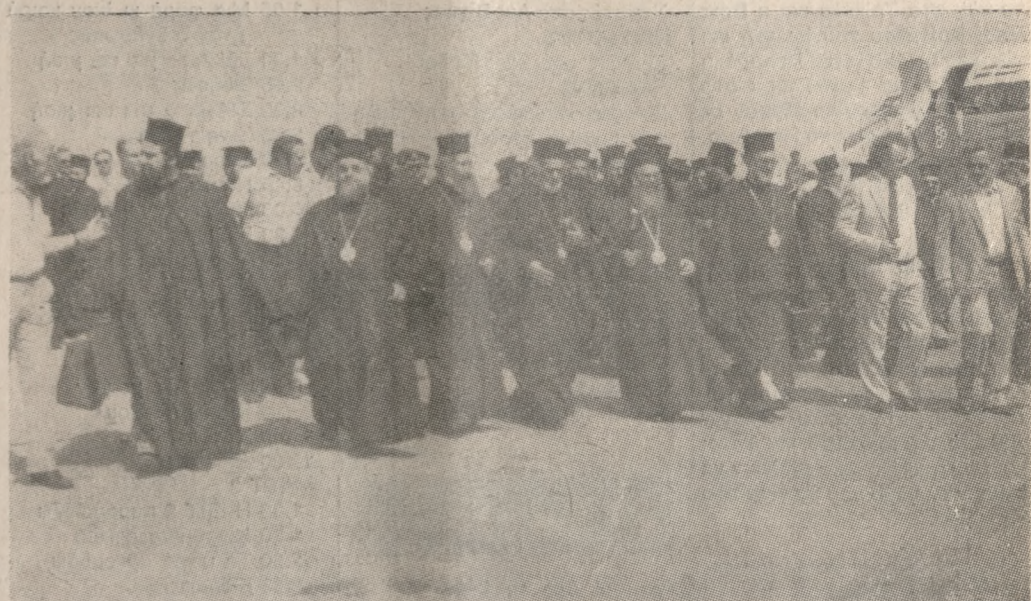
Η Πατριαρχική Εξαρχία συνοδευόμενη από εκπροσώπους της Εκκλησίας της Κρήτης, αμείωως μετά την άφιξη της στο αεροδρόμιο του Ηρακλείου.

Εμείς, δεν θα τοποθετηθούμε υπέρ της μίας ή της άλλης πλευράς, αφού γίνεται προσπάθεια επιλύσεως του θέματος, και γιατί για την εφημερίδα μας πάνω από όλες τις θέσεις και τις απόψεις, βρίσκεται το καλώς νοούμενο συμφέρον της Εκκλησίας της Κρήτης. Σημειώνω όμως, την σπουδήποτε άκαιρο τοποθέτηση του Προέδρου της Εξαρχίας, ο οποίος, βεβαίως, δικαιούται να έχει τις απόψεις του, αλλά δεν νομίζουμε ότι εδικαιούται να τις διατυπώσει δημοσίως, πριν καν έλθει σε επαφή με όλους, και ακούσει έστω και τυπικά, τις δι'εταμένες απόψεις.