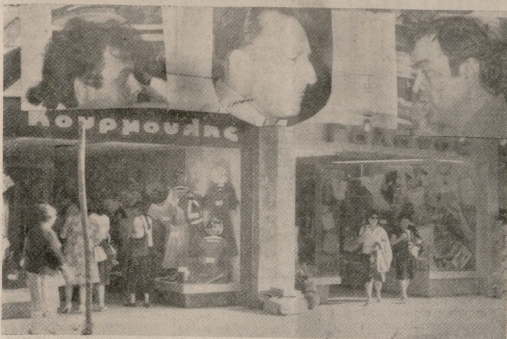
Ντάλα μεσημέρι — 1.30' με 4.30' χθές — τρία κτιστήρια της Καλοκαιρίας, έπασαν θύματα διαρρηκτών. Τα δύο (Κουρμούλη - Γαλανού) δίπλα-δίπλα. Οι καταστηματαρχές (από αριστερά προς τα δεξιά Γαλανός, Καβαλάκης, Κουρμούλης) τι να πούν; Φωτορεπορτάζ: GRAPHOT τηλ. 221830