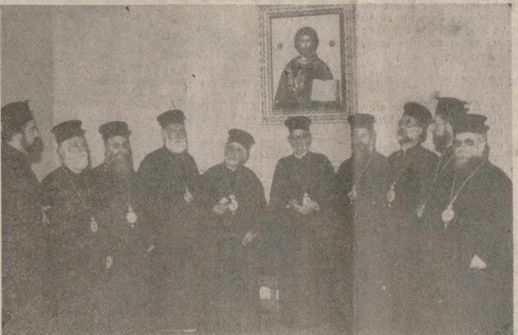
Τα μέλη τής Πατριαρχικής Εξάρχιας με Μητροπολίτες τής Εκκλησίας Κρήτης, λίγο μετά τη σύσκεψη.

Εκ του Διοικητικού Συμβουλίου τής Τσιμεντοβιομηχανίας Κρήτης Α.Ε.