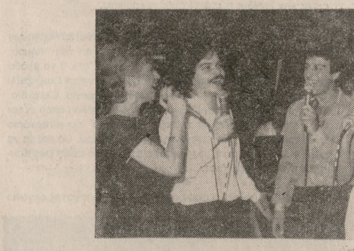
Κεφάλαιο Λαϊκό Πρόγραμμα.