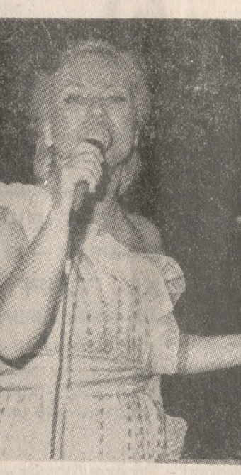
Η πρώτη φωνή του Ελλ. τραγουδιού.