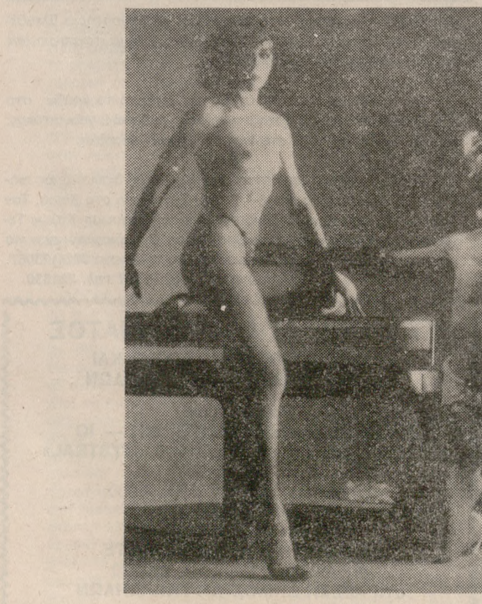
«THE FUGITIVES» Από την Γαλλία. ΚΑΤΙ ΠΟΥ ΠΟΤΕ ΔΕΝ ΞΑΝΑΕΙΔΑΤΕ RESERVATION: 284443 — 821252